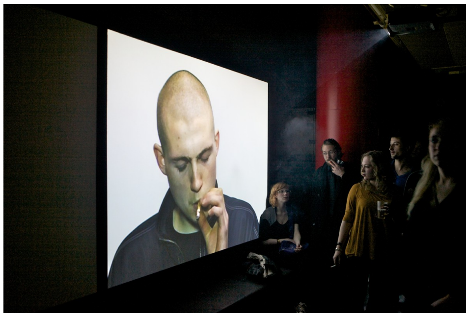
Príloha č.5: Ľudia pozorujúci video The Buzzclub