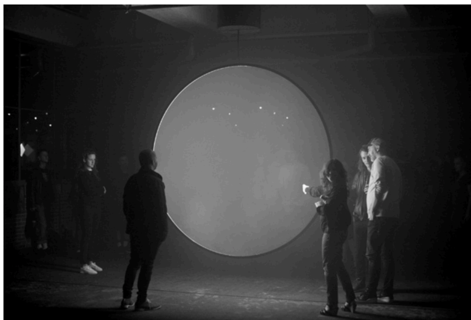
Príloha č.9: Návštevníci klubu De School pozorujúci Diapositive od Children of the Light