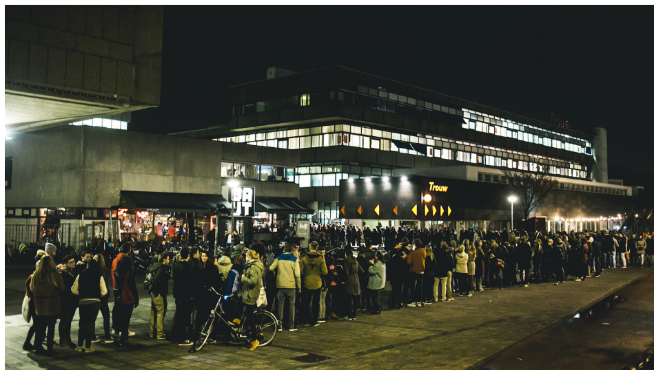
Príloha č. 3: Rad návštevníkov čakajúcich na vstup do klubu Trouw