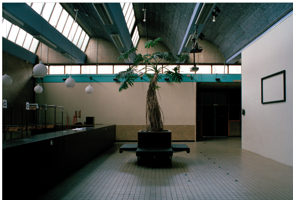
Príloha č. 4: Interiér klubu De School