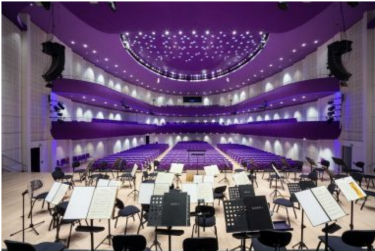
Příloha č. 6 – Kongresové centrum (Velký sál)