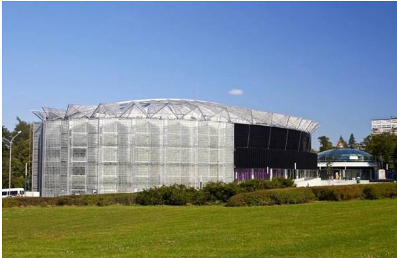
Příloha č. 5 – Kongresové centrum (venkovní pohled)