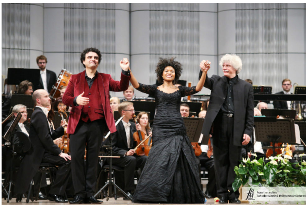
Příloha č. 9 – Koncert s tenoristou Rolandem Villazónem a sopranistkou Pumezou Matshikizou (říjen, 2014)