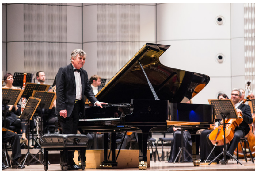
Příloha č. 10 – Koncert s klavíristou Eugenem Indjicem (listopad 2015)