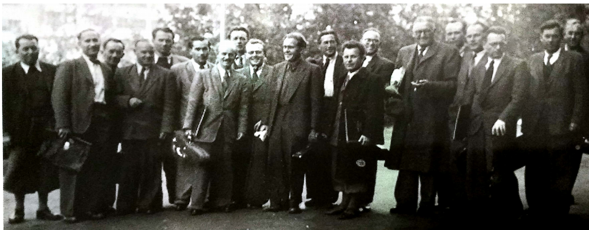
Příloha č. 3 – Skupina členů Zlínské filharmonie po zkoušce před Společenským domem (říjen 1947)

Zdroj: 70. výročí Filharmonie Bohuslava Martinů. Zlín, 2016. (buletin)