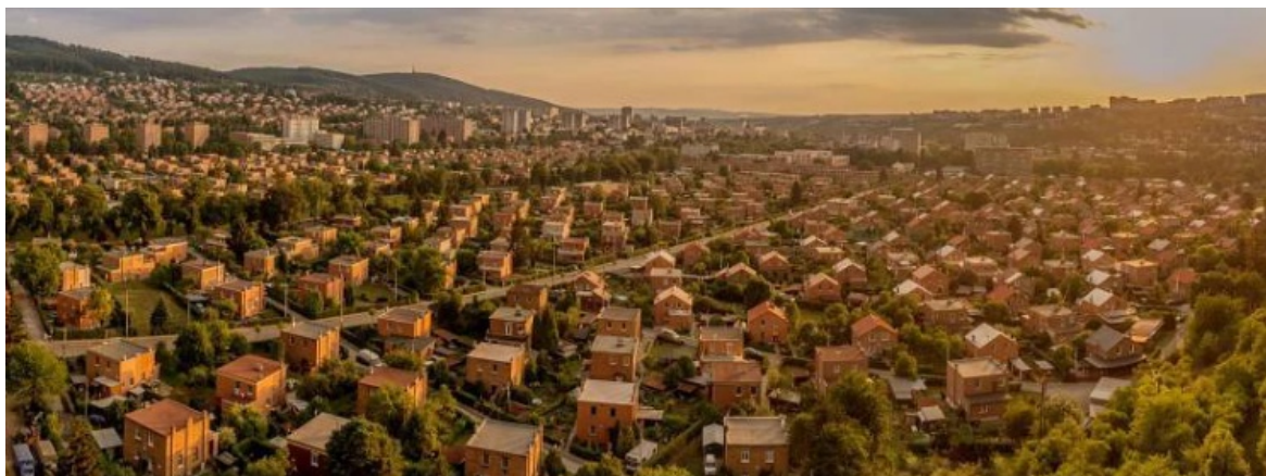
Příloha č. 1 – Pohled na Baťovy domky