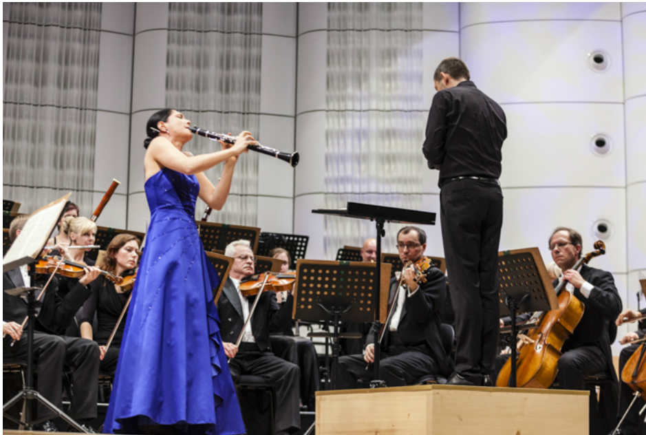
Příloha č. 11 – Koncert s klarinetistkou Sharon Kam (říjen 2013)