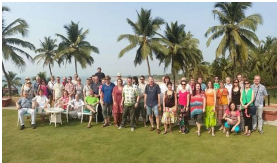
Příloha č. 8 – Zlínští filharmonikové v Indii (leden 2018)