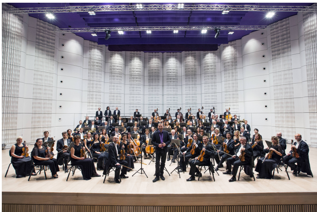
Příloha č. 7 – Filharmonie Bohuslava Martinů (2016)