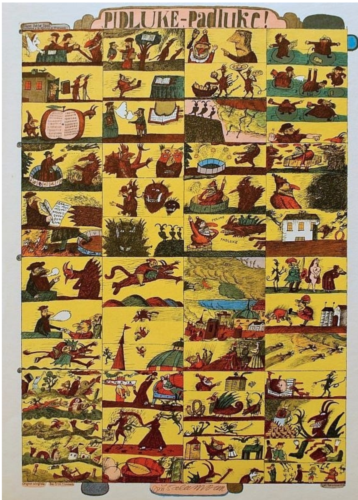
Obr. III – Pidluke-padluke litografie Jiřího Šalamouna. 19