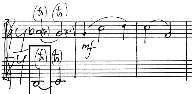
Obr. XII. Technicky nerealizovatelný trylek h-c^1 v partu druhé flétny.

Dalším problémem byl trylek h-c^1 v partu druhé flétny, který není možné zahrát a který jsme v interpretaci nahradily rovným tónem, což lze opět díky zvukové kompaktnosti dvou stejných nástrojů, kdy trylkování první flétny skryje absenci tohoto efektu ve flétně druhé. Autor sám tento trylek uvádí v závorce (Obr. XII.).