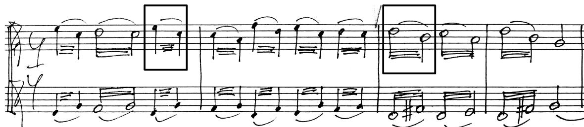
Obr. XI. Obtížně hratelná tremola v partu první flétny.

rychlé výměny mezi dvěma tóny, zredukoval tremola na intervaly tercií, což ale problém nevyřešilo zcela. Přesto je věta ve stávající podobě realizovatelná – problematické spoje, např. e^2-c^2 nebo d^2-h^1 se v souzvuku dvou fléten barevně „ztratí“. (Obr. XI.)