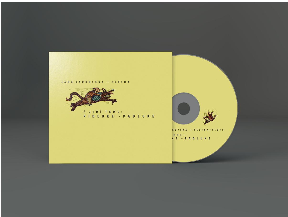
Obr. XVII. Grafická podoba CD Jiří Těml: Pidluke-padluke s detailem grafiky Jiřího Šalamouna. Grafický návrh a vizualizace Jan Flieger, 2018.