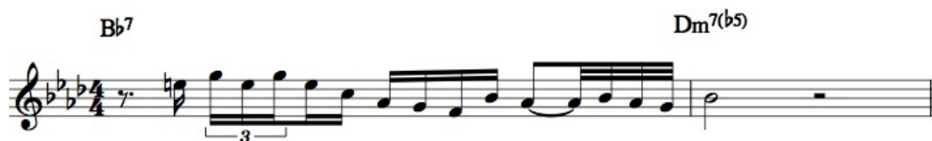
Ilustrace 21: Weird Lullaby, 1. chorus, čas 2:45

Rozklad jde dobře do ruky, je tedy poměrně dobře proveditelný a mezi pianisty oblíbený. Stejný typ rozkladu zazní i v bluesové dvanáctce Sassy na začátku čtvrtého chorusu.