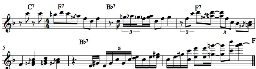
Ilustrace 22: Sassy, 4. chorus, čas 2:08

Rozklad jde dobře do ruky, je tedy poměrně dobře proveditelný a mezi pianisty oblíbený. Stejný typ rozkladu zazní i v bluesové dvanáctce Sassy na začátku čtvrtého chorusu.