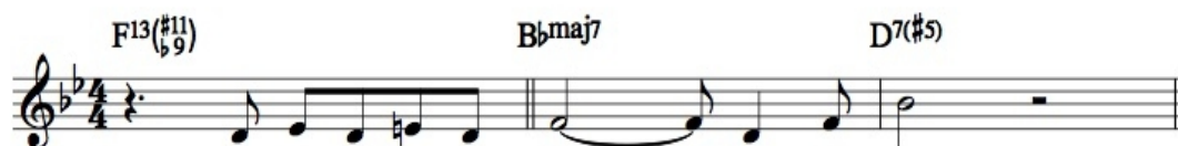
Ilustrace 6: Someday My Prince Will Come, 1. chorus, část A, čas 1:05

Ve stejné písni si také na chvíli pohraje s moll bluesovou pentatonikou. Je si ovšem vědom jistého harmonického napětí, kterého jejím použitím dosáhne, a proto tak učiní velice střídavě. Na ploše druhé poloviny druhého chorusu (tedy částí A a C) tvoří osmitaktovou frázi s předtaktím od akordu G7#5 - v našem případě takt č. 5, až po akord E0, ve kterém už se objeví tón Db, anticipující bluesovou stupnici. Teprve potom do závěrečného čtyřtaktí vloží třítaktovou vsuvku Bb bluesové stupnice, ze které i tak použije pouze její tři tóny Bb, Eb a Db, podpořené tremolem, aby se v posledním taktu formy přes notu D znovu vrátil do durových vod. Vytvoří to skvělý efekt zejména proto, že takového řekněme zábavného momentu nenadužívá.