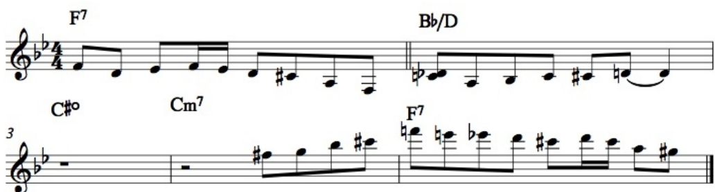
Ilustrace 23: Someday My Prince Will Come, 3. chorus, část B, čas 2:25

S oblibou také na dominantě rozkládá akord s velkou sextou i se zvětšenou kvintou zároveň. Tento charakteristický zvuk akordu můžeme slyšet na dominantě F7 ve skladbě Someday My Prince Will Come a na dominantě C7 ve skladbě Sassy.