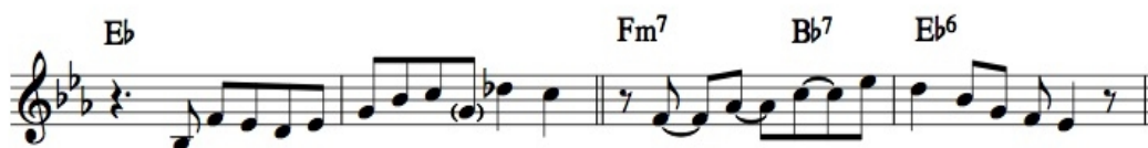
Ilustrace 4: Gone With The Wind, 1. chorus, část A, čas 0:32

Frázování je ve hře každého muzikanta zřejmě nejzásadnější věcí, v našich hudebních končinách bohužel ne zcela automatickou, neboť odkaz naší lidové hudební tradice se bohužel o takové záležitosti neopírá.