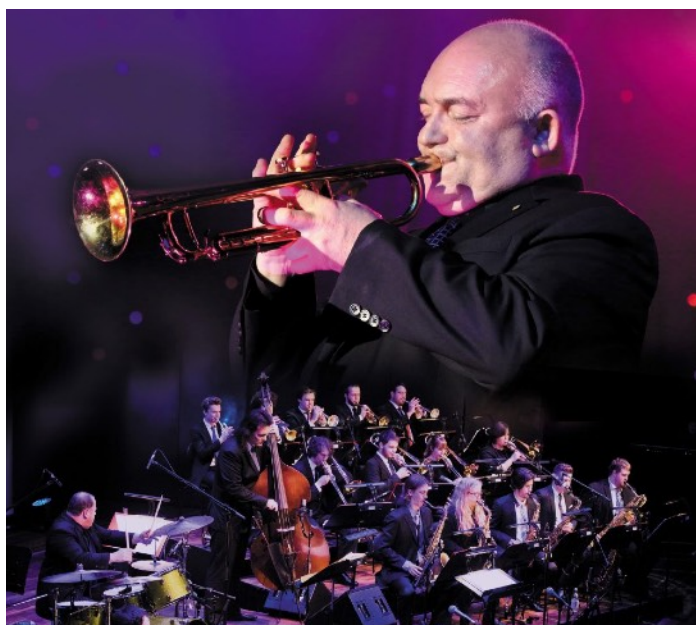
Obrázek č. 4 - James Morrison Academy Orchestra

Další "kapelou", se kterou James Morrison vystupuje, je James Morrison Academy Orchestra . Jedná se o big band mladé generace hudebníků z australské akademie jazzu. Morrison díky tomuto orchestru umožňuje mladým studentům jazzu, aby koncertovali přímo s ním a učili se od něj.