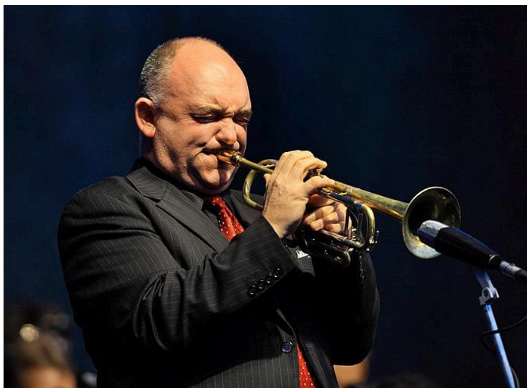
Obrázek č. 1 - James Morrison na koncertě v Českém Krumlově v roce 2010

Podoby jazzu od “neworleankého” přes ragtime, swing, bebop, fusion, free jazz a další jeho odnože mi jako klasickému hudebníkovi nepřísluší podrobně popisovat a ani to není tématem práce. Ovšem jsem si vědom, že tento hudební styl je velmi frekventovaným a z výše popisovaného baru v New Yorku se jeho podoba nyní dostala na koncertní pódia, spojuje se s klasickým symfonickým orchestrem a hledá nové a nové využití. James Morrison se pohybuje v různých jazzových podobách a koncerty uzpůsobuje tomu, co je žádáno. Můžeme ho slyšet v malém jazzovém klubu, kde vystupuje se svým kvartetem, nebo navštívit jeho koncert s bigbandem a na druhé straně často vystupuje se symfonickým orchestrem nebo v jiných netradičních podobách.