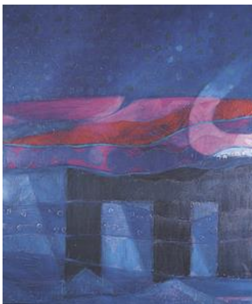
Obr: Mar de Lurín by Fernando de Szyszlo (b. 1929).

Noty jsou taktéž dostupné na webových stránkách autora.