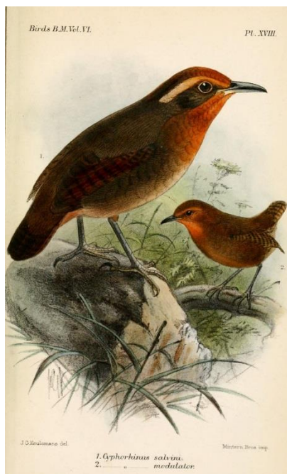
Obr: Uirapurú, Cyphorhinus arada . Catalogue of the birds in the British Museum. Volume 6.

Eastwoodovi byla inspirací brazilská folklórní legenda o kouzelném ptáku Uirapurú. V předmluvě vydání Chantarelle píše: „Uirapurú je drobný pták skrytý ve větvoví obrovských stromů Amazonských pralesů. Když zazpívá, všude kolem nastane radost a lidé i zvířata se zastaví, aby poslouchali. Každému, kdo získá Uirapurú do svých rukou, dostane se obrovské moci, a to zejména v lásce. Proto je pták nemilosrdně loven“ (Eastwood, 1983). Tato legenda má však ještě několik dalších variant.