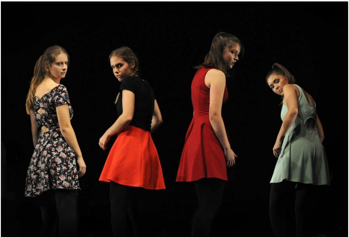
Obrázek 1. O(TÉ), 2018