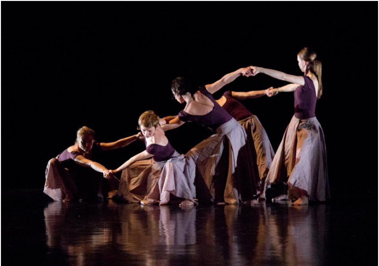
Obrázek 2. Ženské otázky, 2014