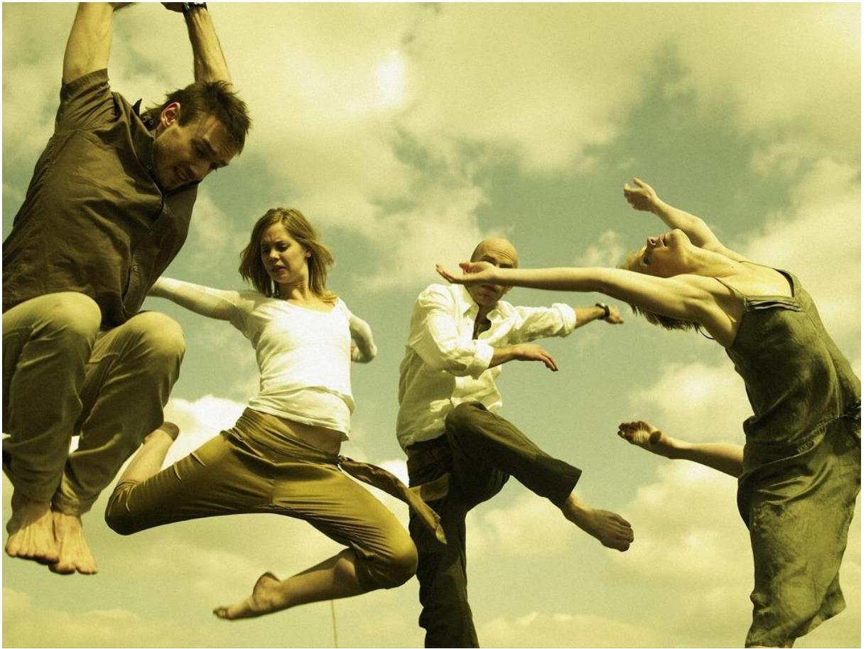
Obrázek 3. Ilustrační foto souboru, 2006, Foto Stanislav Merhout