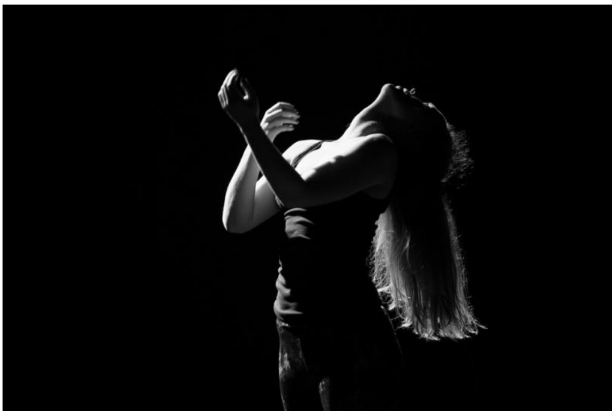
Obrázek 6. Choreografie Okamžik proměn