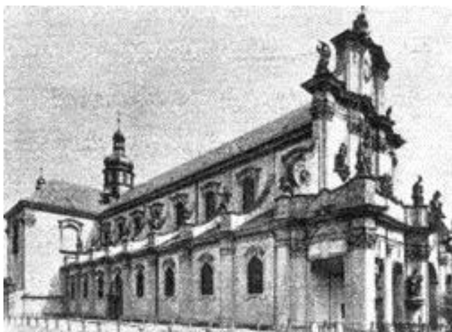
Obrázek č. 3: Osek u Duchcova

Můžeme říci, že mnoho přínosných změn přišlo právě v období klasicismu. Český hornista Antonín Josef Hampel (1705- 1771) 32 přišel s novým způsobem uchopení nástroje. Původní držení nástroje bylo korpusem nahoru. Hampel korpus otočil směrem dolů, k pravému boku hráče, čímž umožnil pohyblivost ruky v korpusu a zavedl takzvanou techniku krytí a obohatil rozsah nástroje o chromatiku 33 . Tato technika spočívala v ucpávání korpusu pravou rukou. Přirozený tón se tak snížil o půl tónu (tuto techniku využívají hráči na lesní roh dodnes, pod označením bouche sound: +). Hráči se mohli zdokonalovat v nové technice například v klášteře Osek u Duchcova.