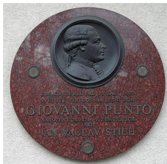
Obrázek č. 8. Pamětní deska v Čáslavi