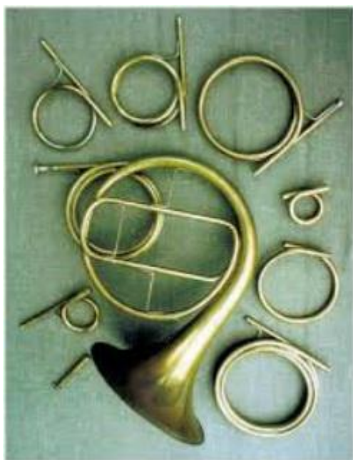
Obrázek č. 5. Invenční roh

Ve spolupráci s drážďanským nástrojařem Johanem Wernerem, vynalezl Hampel kolem roku 1750 invenční roh. Velkou výhodou tohoto nástroje byly přeladovací kotouče-tzv. invence. Kruhovitě stočené kotouče ve tvaru U byly pohyblivé, takže se dalo (podobně jako u invenčních trumpet) doladovat klasickým vytažením či zaražením kotouče. Invence se daly měnit, tím pádem se hráč mohl pohybovat v různých tóninách (nejčastější: in F, in G, in E, in Es, in D a in C). 34 Například při pražské premiéře roku 1787 se v Mozartově opeře Don Giovanni se ladění změnilo až 36 krát (což by znamenalo střídání invencí co 5 minut). 35 I přes toto významné obohacení nástroje mnoho hráčů té doby techniku krytí neovládalo. Přesto se ale díky těmto inovacím stal lesní roh plně využívaným melodickým a sólovým nástrojem 36 .