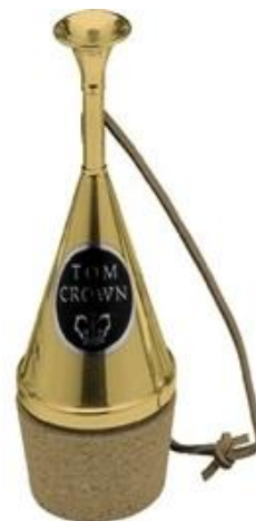
Obrázek č. 4: Bouche sordina