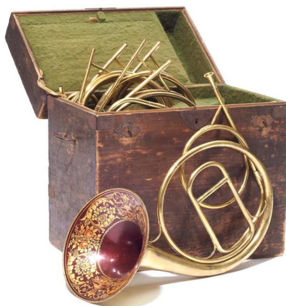
Obrázek č. 6. Zdobený korpus