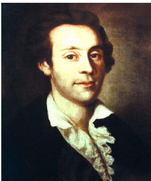
Obrázek č. 1. Rosetti