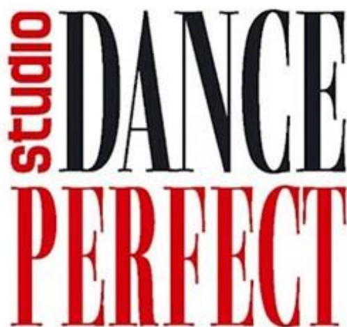
Logo Dance Perfectu

atmosféru a klienti odcházeli s úsměvem na rtech. Majitelka studia mi návštěvu lekce klasického tance poskytla zdarma. 99