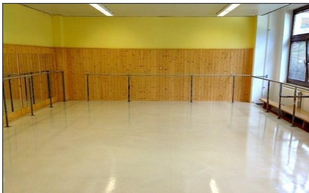
Taneční sál v TŠ Cinderella