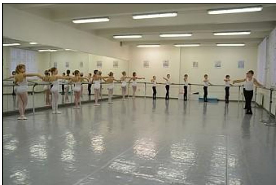
Výuka dětí v sále 1 v BŠ Pirueta