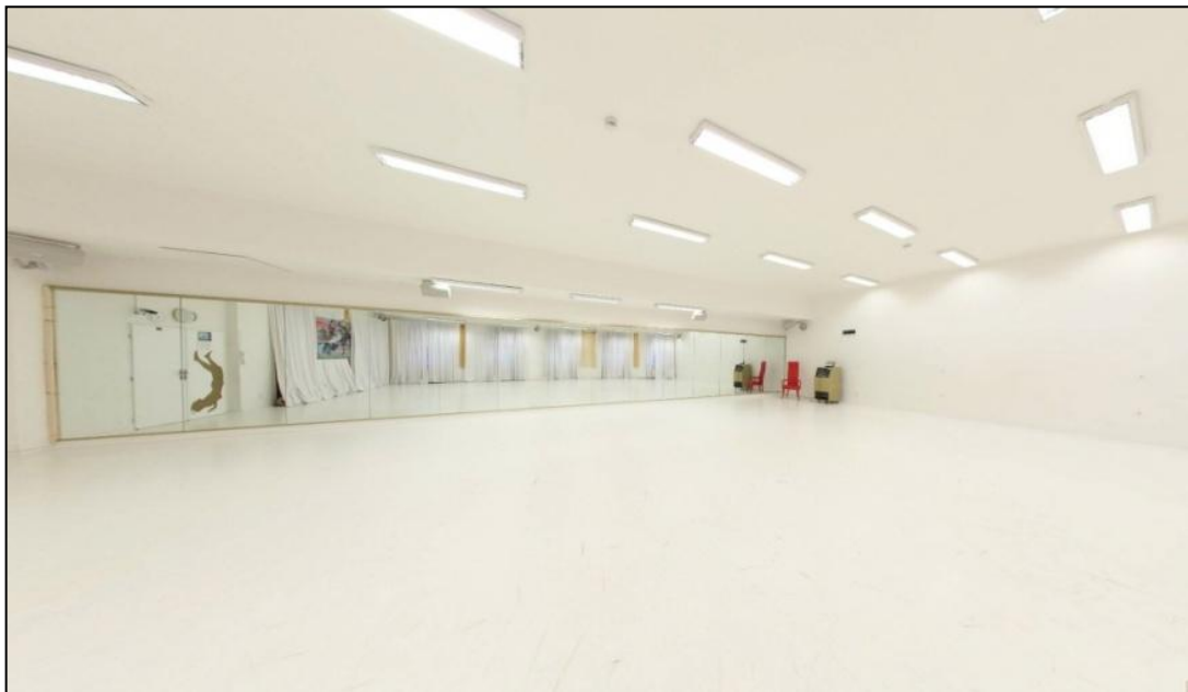
Velký sál studia Contemporary – prostor pro tanec

(dostupné z https://www.centrumtance.cz/tanec/Saly.asp?S=&uid={5EDED25F-49FA-4BEE-BC7C-A7D1E41AFFE9}&mrcd=PRAH )