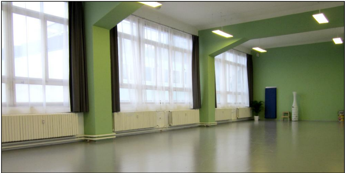
Taneční sál v Centru tance v Praze