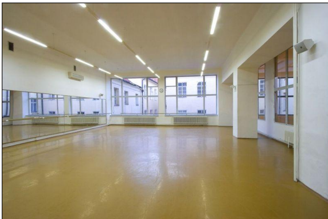
Velký sál studia Dance Perfect (dostupné z http://www.danceperfect.cz/cz/prostory )