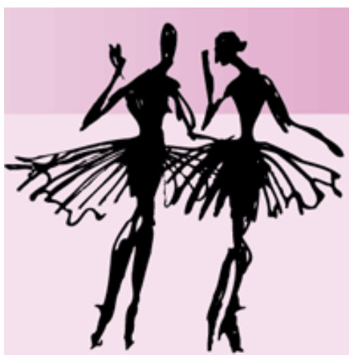
Logo Taneční školy Cinderella

prvek vyzkoušeli a opravili. Jako hudební doprovod pedagožka zvolila klavírní skladby pro baletní hodiny z cd nosiče. Lekce mi byla poskytnuta zdarma. 105