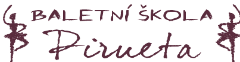
Logo BŠ Pirueta

Hodinu vedl vyškolený a zkušený pedagog, proto dokázal vysvětlit i těžší prvky a odpovědět na otázky zvědavých klientek. Cvičení srozumitelně zadal a předem upozornil na časté chyby konkrétních prvků. Jeho studentky poté cvičily samy, ale když kombinaci dodělaly, zřídka jim sdělil hromadné či individuální korekce. Lektor se snažil navodit a udržet zábavnou atmosféru, která byla zčásti také dána vzájemným tykáním. Kombinace celé lekce byly logicky vystavěné, avšak často mezi nimi byla příliš dlouhá pauza související s hudebním doprovodem, jelikož pedagog často nemohl nalézt správné tempo či skladbu a neustále vyměňoval cd disky. Preferována byla klavírní hudba upravená pro baletní lekce. Jednorázová hodina stála 200 Kč. 55