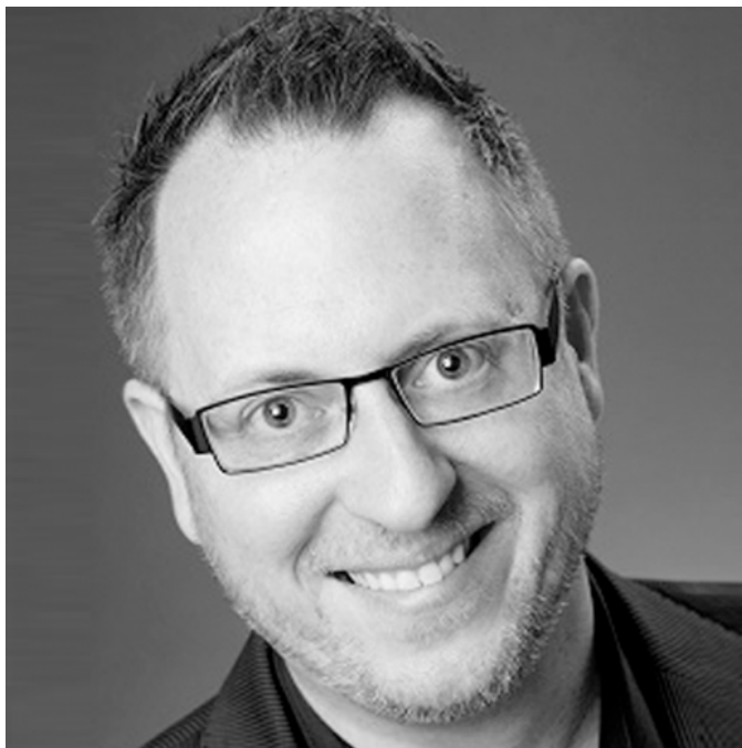
Andrew Bisantz 5

Vynikající mladý americký dirigent Andrew Bisantz je všestranný hudebník, ceněný díky svému zanícenému a suverénnímu ovládnutí orchestru jak u známých amerických orchestrů, včetně Buffalo Philharmonic a Rochester Philharmonic, tak u operních scén a festivalů (Boston Lyric Opera, Florida Grand Opera, Glimmerglass Opera, Wolf Trap Opera a Brevard Music Festival ve státě North Carolina). Rychle vybudoval imponující portfolio úspěšných vystoupení.