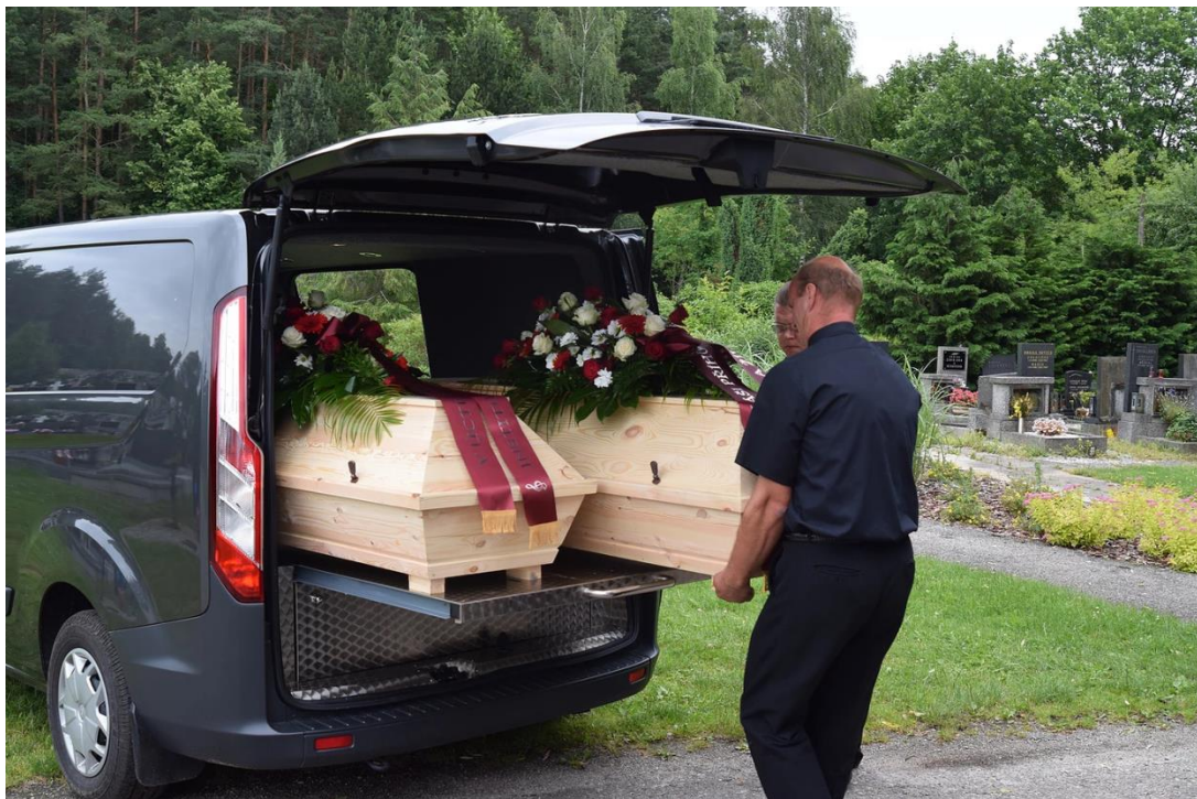
Ukládání ostatků ve Vodňanech, červen 2016