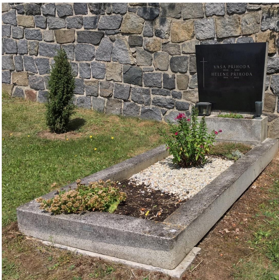
Hrob ve Vodňanech, 2018