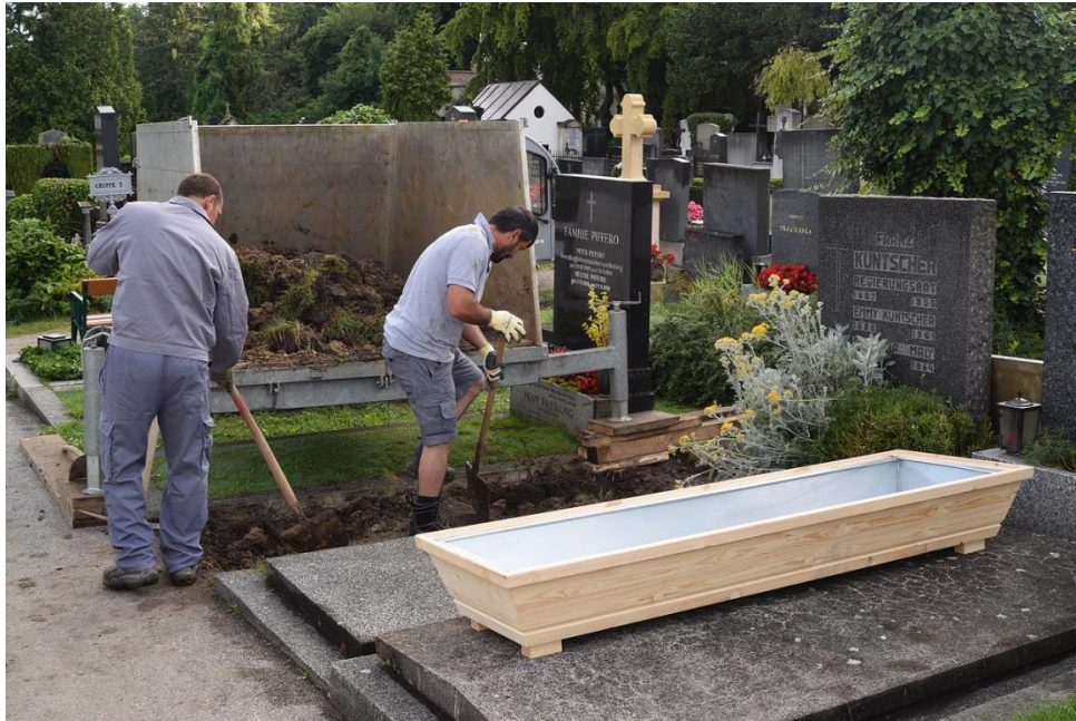
V průběhu exhumace, červen 2016, foto: Jaroslav Žíla