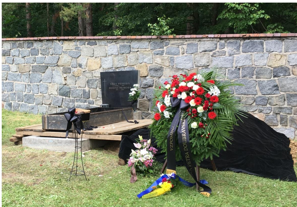
Ukládání ostatků ve Vodňanech, červen 2016, foto: Ladislav Helcl