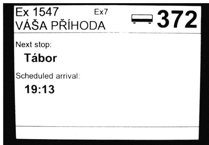
foto: display uvnitř vozu čd historicky prvního vlaku jménem „Váša Příhoda“ po odjezdu z Prahy hl.n.