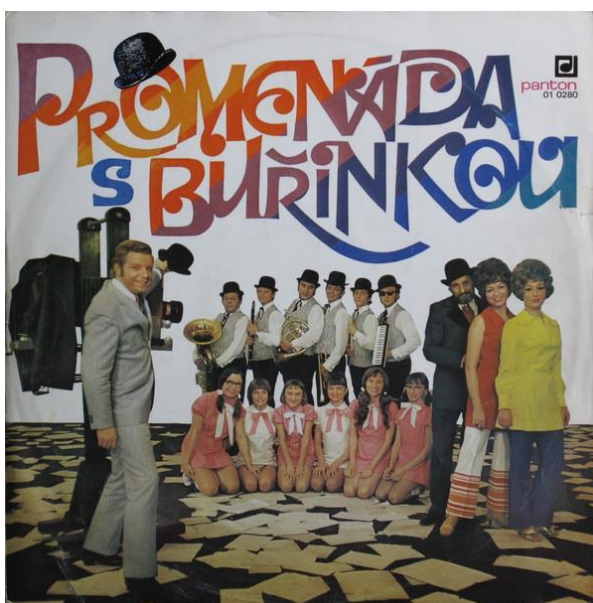
titulní strana vinylové desky Muzika bez kapelníka – Promenáda s Buřinkou z roku 1971