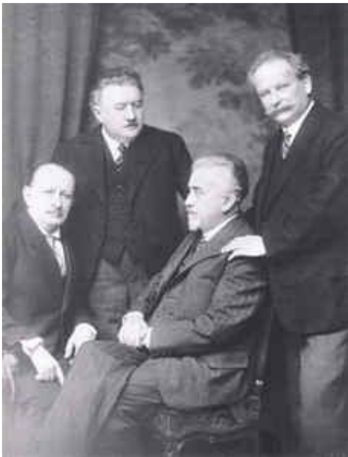
Obrázek 8: České kvarteto ve svém posledním obsazení