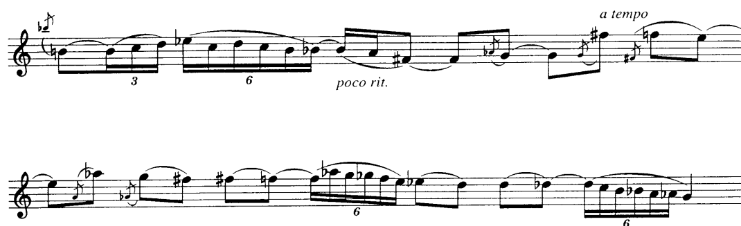
Obrázek 5: Plog-Postcards

Samotný skladatel doporučil, pokud jsou přítomny stejné noty po sobě, hrát je zcela stejně. Obdobně se Plog vyjadřuje i k hraní technických pasáží. Navrhuje usilovat hlavně o vyrovnanost a přehnané artikulace pro jeho skladbu mu přijdou nežádoucí. Myslím si, že nejdůležitější při nácviu této skladby je striktní řád metronomu.