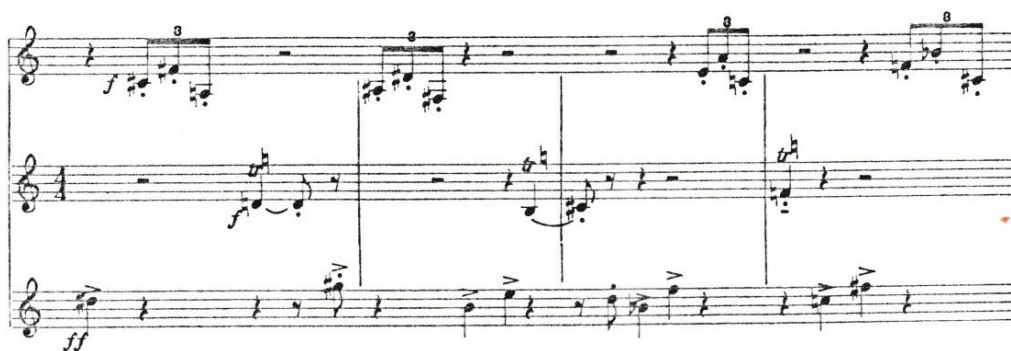
Obrázek 8: Henderson, notový zápis

V páté větě máme zajímavost týkající se notového zápisu. Sólový part je vypsán do třech samostatných notových osnov. Nikdy jsem se s takovýmto zápisem nesečkala, ale myslím si, že pro každého trumpetistu to představuje určitým způsobem výzvu. Posлуhač by podle autorova přání neměl být schopen rozeznat, z kterého řádku zrovna interpret hraje. Každý řádek má svá specifika, asi z důvodu lepší orientace a rozlišení všech použitých motivů. Například první řádek v triolových hodnotách, druhý řádek v trylcích, třetí řádek ve čtvrtových notách.