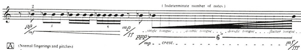
Obrázek 2: Friedman-Solus, doodle artikulace

Další z nároků kladené na technické dovednosti interpreta je schopnost zahrát pedálové tóny. Při samotném cvičení jdou pedálové tóny zahrát bez větších obtíží, ovšem v kontextu s ostatními notami ve skladbě si myslím, že to není zcela jednoduché. Důležité je, aby byl každý pedálový tón přesně intonovaný. Dále můžeme ve skladbě spatřit tremola, či trylky na jednom tónu, retné trylky i kombinace tremola a trylků dohromady. Řekla bych, že tempo a rytmické zápisy si může daný umělec přizpůsobit svému tempu a své osobnosti. Určitým způsobem je svoboda od autora přímo povolena. Skladby tohoto typu vlastně nastávající generaci trumpetistů připraví do světa hudby na vyšší úrovni a jedinečné prvky se tak stanou standartní výbavou každého trumpetisty.