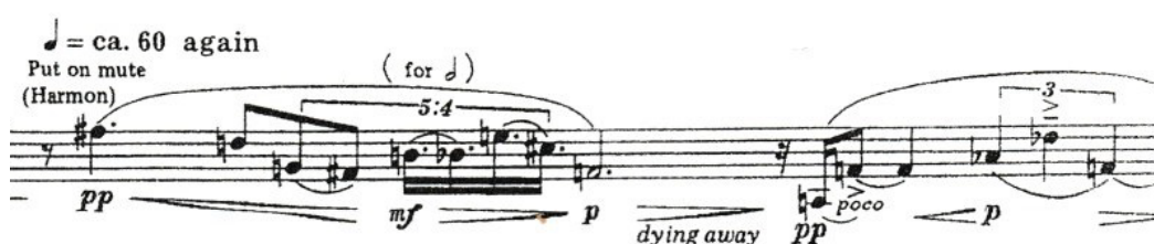
Obrázek 11: Takemitsu-Paths

Skladba pro sólovou trubku, „ Paths “ je z roku 1994. Premiéru odehrál trumpetista Håkan Hardenberger, kterému byla také dedikována. Odehrála se na koncertě Pocta Witoldu Lutoslawskému , kterému byl koncert věnován, jelikož 7. února v roce 1994 Witold Lutoslawski zemřel. Koncert se uskutečnil na polském festivalu, Varšavský podzim, konaném 21. září 1994. 51 Skladba je psaná pro trubku v ladění in C a velmi důsledně skladatel pracuje s dusítkem harmon. Jde o zajímavý prvek, kdy na to abychom dusítko zasunuli nebo vysunuli nemáme dostatek pauz a přílišná aktivita by mohla narušit meditativní tok skladby. Proto se využívá dusítko na stojánku, ke kterému vždy jen přistoupíme nebo odstoupíme. Můžeme říct, že se jedná o dialog mezi trubkou bez dusítka a s dusítkem. Nevyskytují se zde žádné krkolomné technické pasáže, ani těžko dosažitelný rozsah. Hlavní podstatou celé této skladby je především hluboký melodický podtext. První poslech této melancholické skladby nás může zmást. Nezdá se nijak technicky náročná ovšem při pohledu do not nás zarazí rytmické značení, které se jeví obtížné. Především v drobnějších hodnotách dochází ke složitým počtům.