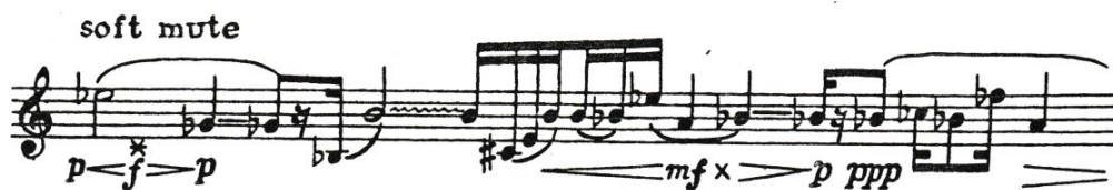
Obrázek 9: Henze-Sonatina pro sólovou trubku, druhá věta, efekty dusítka soft mute a čtvrttónové vibrato

Poslední část nese název Segnali v překladu signál. Tato část je nejsvižnější s čtenými intervalovými skoky. Ve skladbě Sonatina najdeme širokou škálu trubkových efektů, přes frullato, označené dusítkové vyndání na určených místech až po čtvrttónové vibrato.