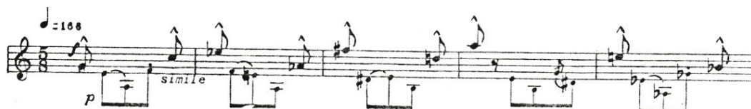
Obrázek 6: Henderson-Variation Movements, druhá věta, notový zápis