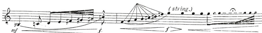
Obrázek 10: Rautavaara-Tarantará

„ Tarantará “ je skladba z roku 1976. 48 Vznikla pro národní žesťovou soutěž v Helsinkách a je dedikovaná Reimanu Jaatinenovi. 49 Skladba má velmi zajímavý notový zápis. Například můžeme zmínit zápis not do tvaru vějíře. Tento typ zápisu hrajeme jako melodickou ozdobu. Podle autora se má tato melodická ozdoba hrát velmi rychle. Na konci první stránky si můžeme ukázat další pozoruhodnost, samostatně napsané noty g2. Opět podle autora se mají tyto noty hrát ve střední délce. Zajímavým prvkem je grafické znázornění postupného zrychlování.