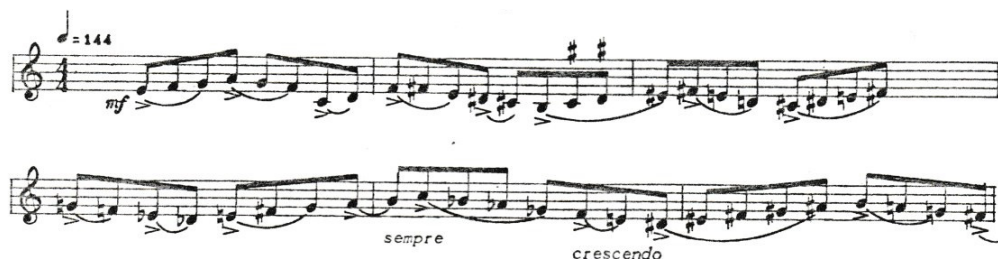
Obrázek 7: Hendreson-Variation Movements, třetí věta, artikulace

V páté větě máme zajímavost týkající se notového zápisu. Sólový part je vypsán do třech samostatných notových osnov. Nikdy jsem se s takovýmto zápisem nesečkala, ale myslím si, že pro každého trumpetistu to představuje určitým způsobem výzvu. Posлуhač by podle autorova přání neměl být schopen rozeznat, z kterého řádku zrovna interpret hraje. Každý řádek má svá specifika, asi z důvodu lepší orientace a rozlišení všech použitých motivů. Například první řádek v triolových hodnotách, druhý řádek v trylcích, třetí řádek ve čtvrtových notách.