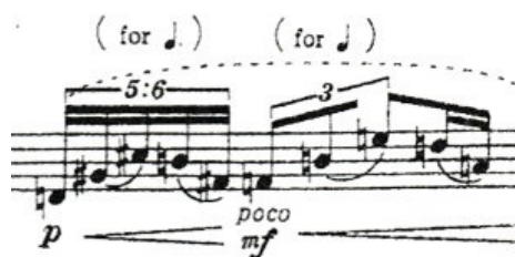
Obrázek 12: Takemitsu-Paths

Může nám tedy připadat, že skladatel nám v interpretaci dává určitou volnost, nicméně jak notace dokazuje, vše je pečlivě vypočítáno s pevným řádem.