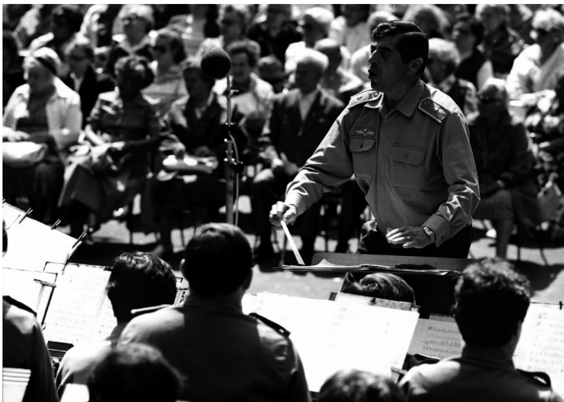
Obr. 5 Koncert Posádkové hudby Praha v zahradě Na Valech na Pražském hradě 30. 5. 1982