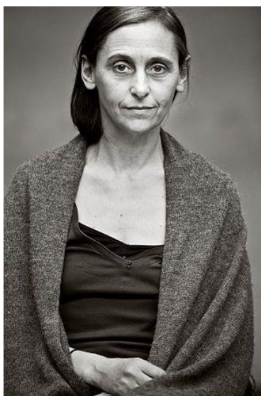
Obrázek 2: Anne Teresa Baronesse de Keersmaeker