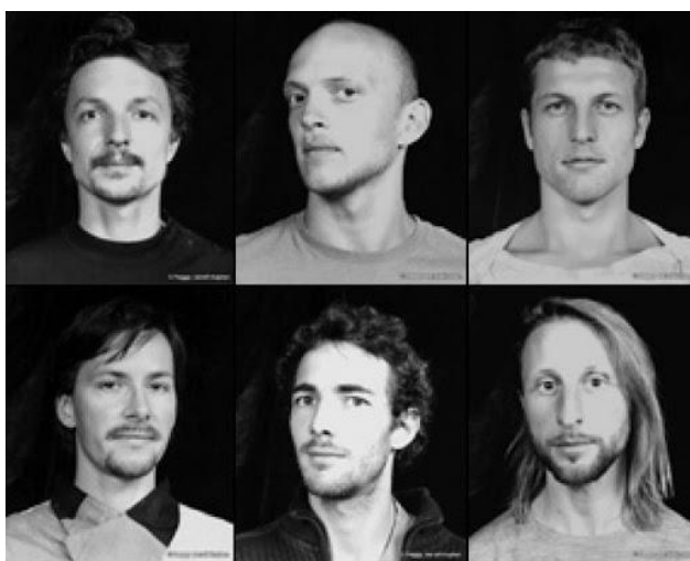
Obrázek 5: Les SlovaKs