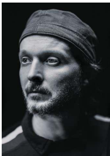
Obrázek 3: Sidi Larbi Cherkaoui