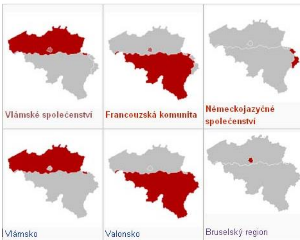
Obrázek 1: Dělení Belgie podle společenství.