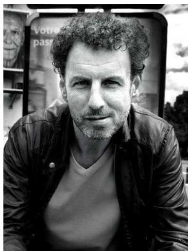
Obrázek 4: Wim Vandekeybus