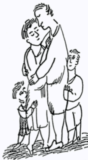
kolem mě toho štěstí byly celý metráky

Dvacátý úterý roku devatenáct set sedmdesát pět.