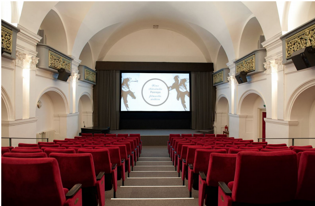
Obr.2. – kinosála Ponrepa

Už na prvý pohľad nie príliš prítažlivá a malá sála filmotéky SFÚ nepôsobí ako miesto, ktoré by sa snažilo o pozornosť širokej verejnosti. Treba však poznamenať, že pri odhadovanej vyššej návštevnosti sa projekty presúvajú do väčších kinosál – do K1 alebo K2, kde kapacita presahuje 100 návštevníkov. Spravidla sa tak deje pri filmovom vzdelávaní. Priestory a atmosféra s filmotékou NFA sú však neporovnateľné. Tie taktiež umožňujú bezbariérový prístup, zatiaľ čo kinosála K3 sa nachádza v podzemí.