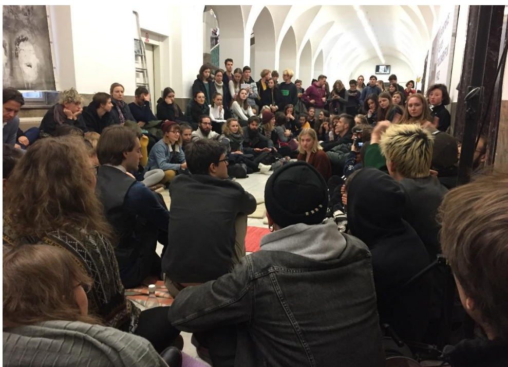
Fotka zachycuje plénum, kde se řešilo jaké, jako máme možnosti v případě, že nám vedení školy nedovolí v budově přespat a donutí nás ji opustit.

Studenti obsadili chodby školy, zatímco v některých posluchárnách probíhala výuka. Organizátoři stávky běžnou výuku nahradili ekologickými a enviromentálními přednáškami. Například na téma jaderná energie nebo popírači ekologické krize. Večer končil praktickým workshopem „Jak komunikovat s policií“. 8