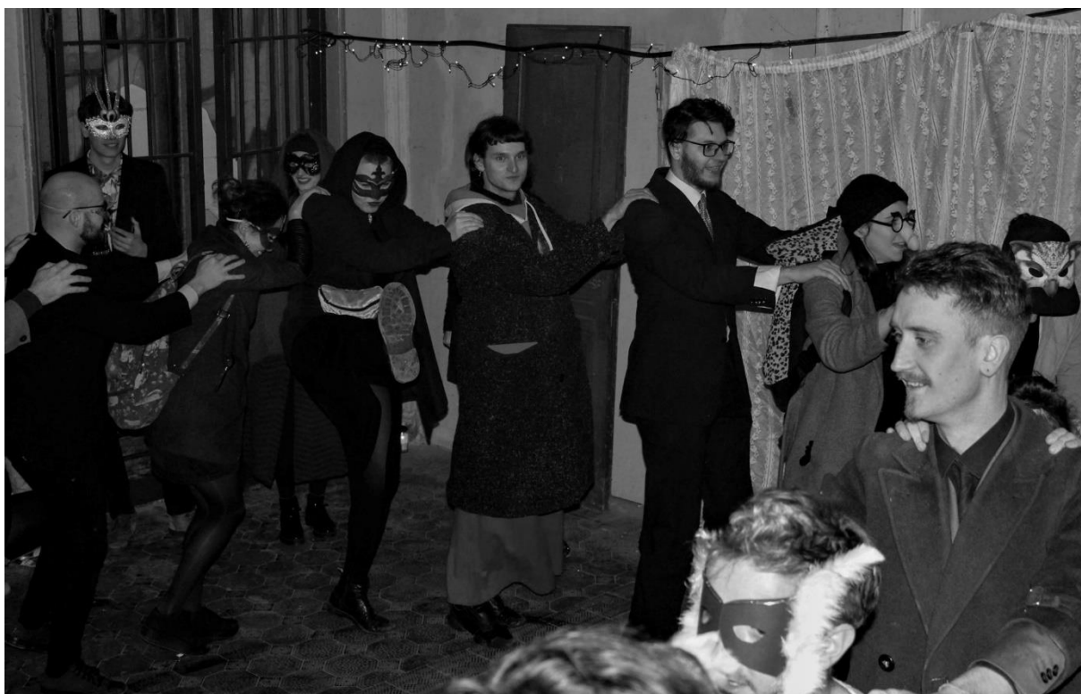
účastníci plesu tančící hada