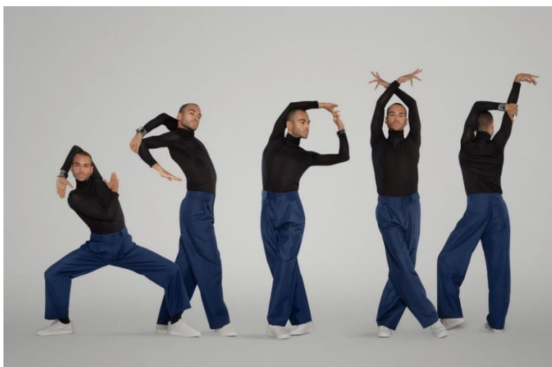
obr. 10 – vogue pozice paží new way 105