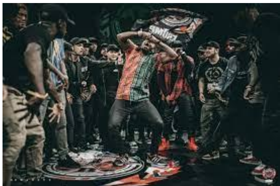
obr. 7 - krump session; zdroj: internet 83

krump seskupení neboli family , Krump Kings a jsou považováni za zakladatele tohoto tanečního stylu. Následoval vznik mnoha dalších skupin, které se sdílením ( session či battle 81 ) formovali a krump se díky tomu posouval rychlým tempem kupředu. 82