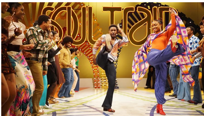
obr. 1 - Soul Train 21

kvalitou či přesným krokem, který dokola opakovali a posouvali se s ním dopředu. Nechyběla podpora ostatních, uvolněná atmosféra a výrazný barevný kostým. 20