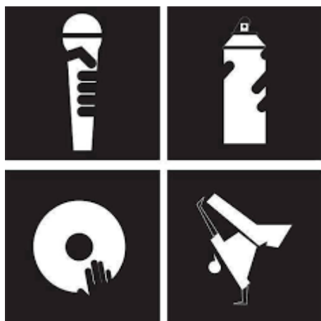
obr. 4 - elementy hip hopu ; zdroj: internet 54

někdy považují znalosti (=knowledge) a móda (=fashion). 50 Samotný pojem hip hop je tedy kromě tanečního stylu označení celé kultury. Často dochází k záměně s pojmem street dance , což je ale označení více tanečních stylů, které vznikly na ulici a mezi které spadal i samotný hip hop . 51 S hip hopem se pojí následující hesla Peace, Love, Unity and Having Fun 52 , která propojují celou komunitu dodnes. 53