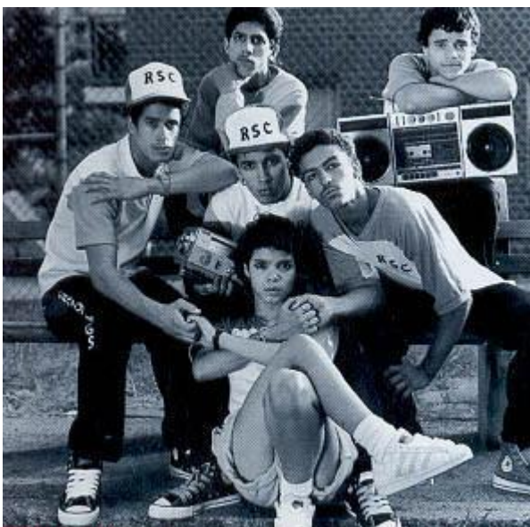
obr. 3 - The Rock Steady crew 45

Hip hopová kultura společně se všemi svými elementy nastavila nový životní styl, novou kulturu, změnila řeč, hudbu, gesta a ovlivnila celý svět duchovní, undergroundový 46 , stejně tak i ten populární, mainstreamový 47 .