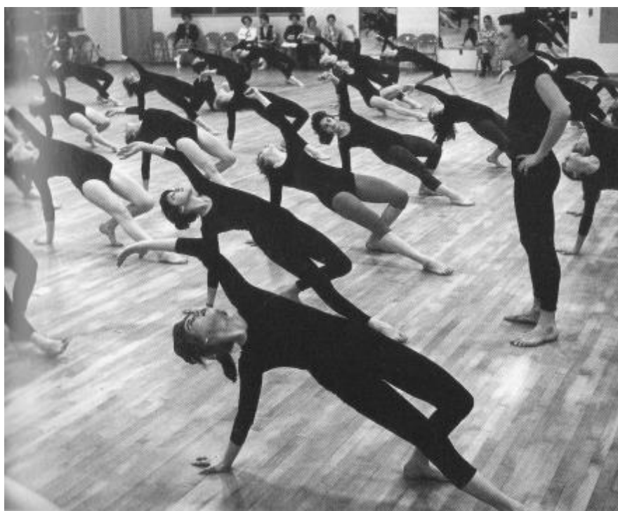
Obrázek č. 4 – Robert Cohan vyučuje v Rochesteru, 1959

paží z indického tance a izolace z jazzu. V důsledku tohoto rozšíření se technika MG stala méně perkusivní a mnohem více plynulá a lyrická. Cohan ve výuce upozorňoval na dech a pracoval s představou, při níž proudí dech až do paží nebo do nohou. Cílem bylo rozvinout cit pro vnímání proudění tekutiny či energie v těle, což fyzicky i vizuálně ovlivňuje samotný pohyb. Později Cohan ve své knize The Dance Workshop napsal, že tanec procvičuje celou bytost 56 , což obhajuje následně: „Když se budete snažit zlepšit pohyby svého těla, budete se čelně srážet se svými emocemi – které dosud mohly vaše tělo ovládat.“ 57 Tato rozvinutá forma techniky MG, kterou zkoumal v Bostonu, je přesně ten styl tance, jenž následně přenesl do Velké Británie.