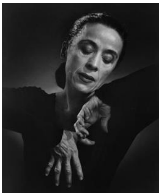
Obrázek č. 1 - Martha Graham