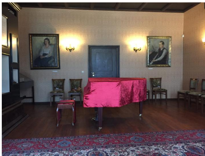
Obr. č. 3: Eduard Tubin Museum

Závěrečná variace je vyvrcholením celé skladby. Skladatel se opět vrací k původnímu tématu. Téma zazní nekompromisně a ve vší síle s charakterem orchestrálního zvuku. V úplném závěru už téma doznívá a postupně se vytrácí až do úplného ticha.