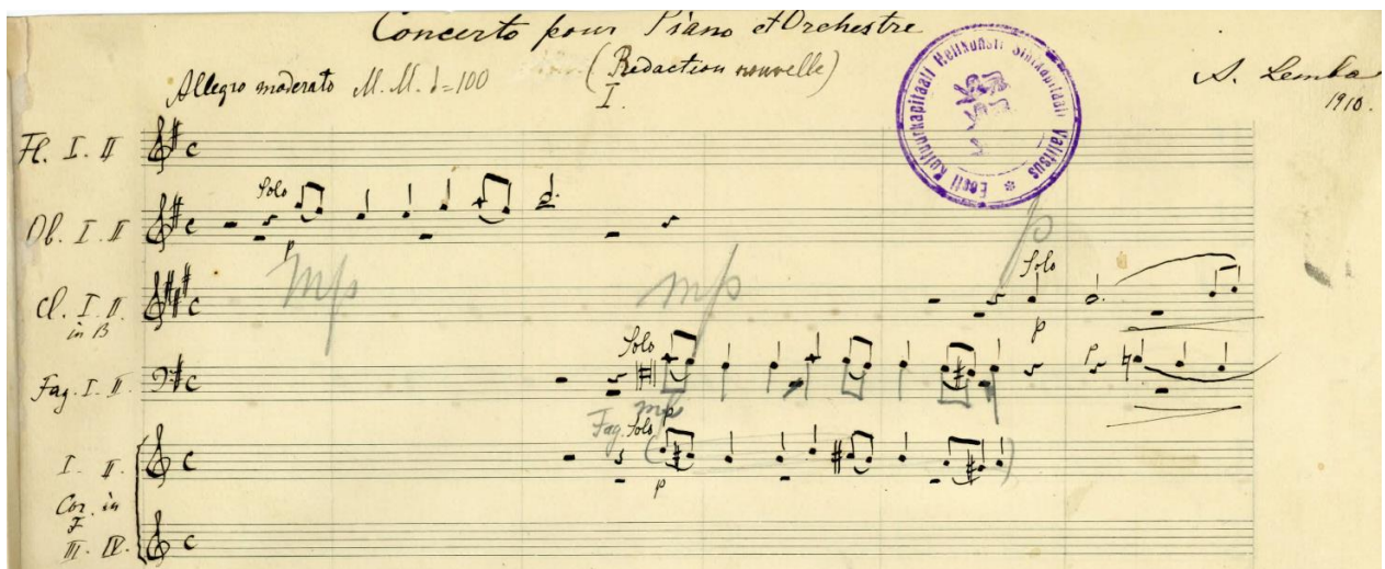
Obr. č. 1: Autograf Klavírního koncertu č. 1 G dur