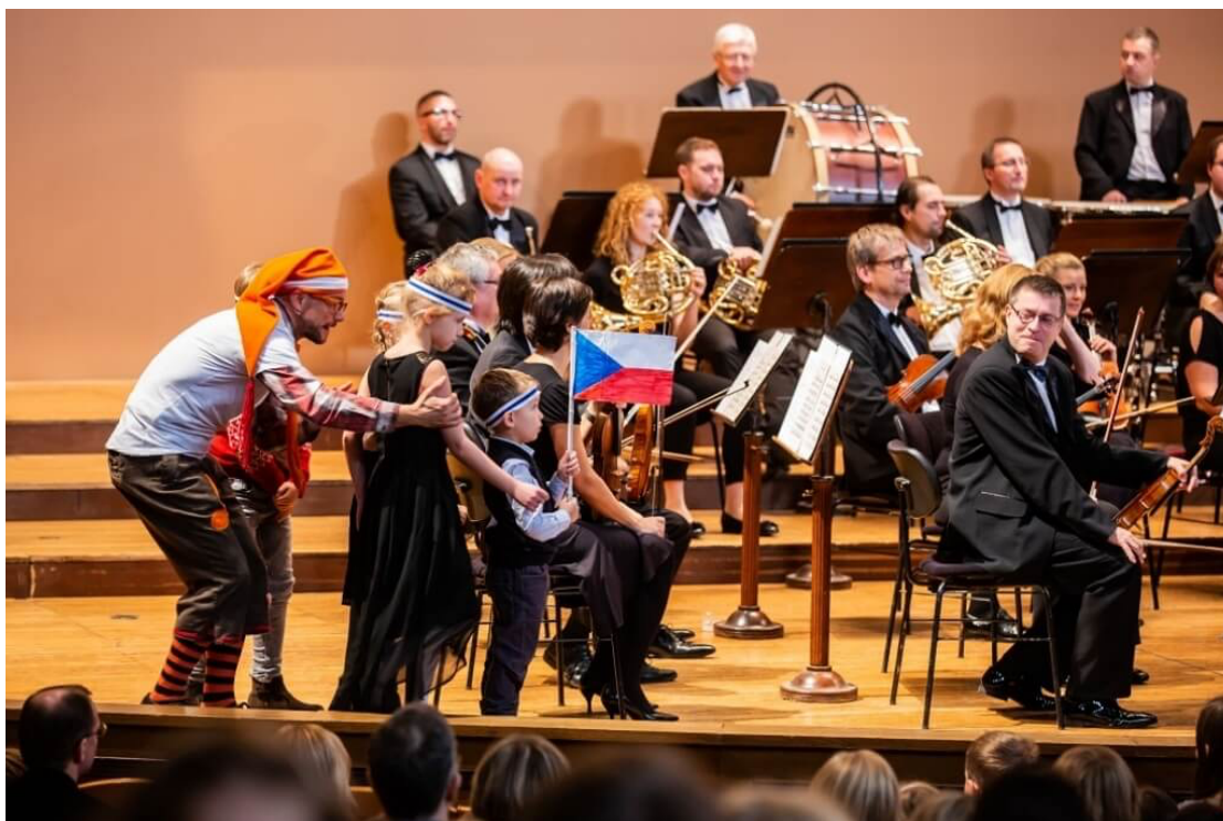
Fotografie EP v orchestru PKF