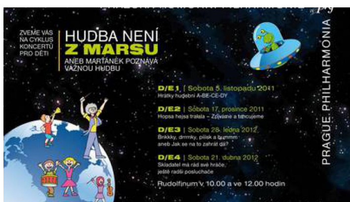
Obrázek 2 Koncerty pro děti aneb Hudba není z Marsu /plakát/ 42