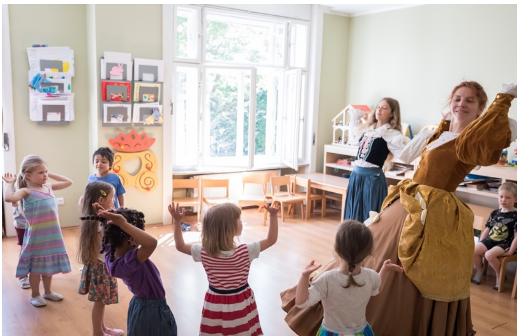
Obrázek 1 30