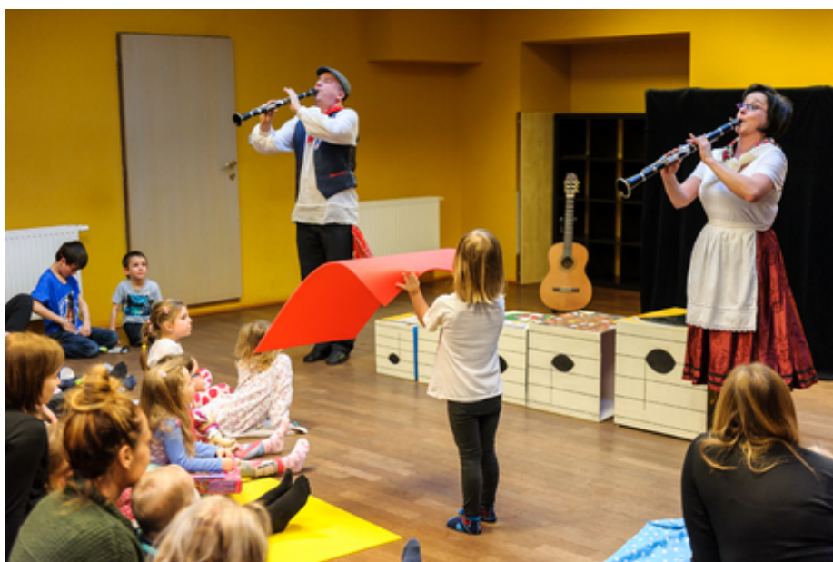
Fotografie Pohádka pro školky