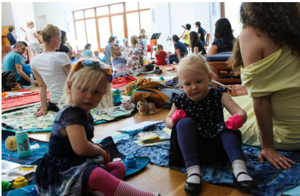
Fotografie Filharmoničtů pro rodiny s dětmi