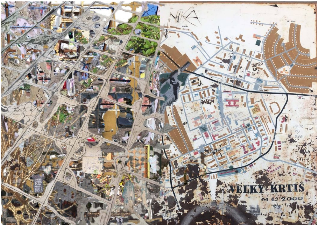
Obr. 2. Mapa Velkého Krtiše od platformy RUVK, ilustrační obrázek článku Realistická Utopia Velký Krtíš, dostupné z: https://artalk.cz/2019/10/25/realisticka-utopia-velky-krtis-male-mesto-ako-laboratorium-rozptylovania-subjektov-a-hegemonii/