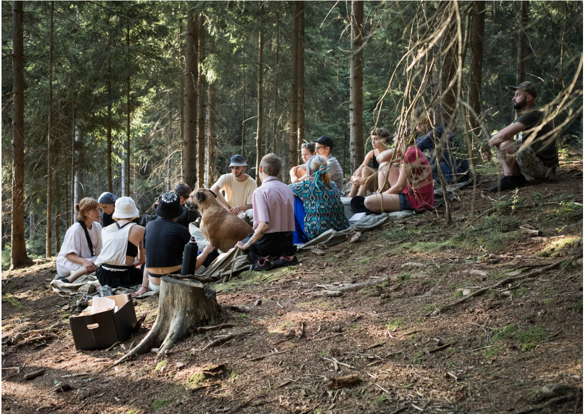
obr. 1. Pracovní skupina (Ne)lidská prostředí, LES – Potomci Hub , sympozium v Orlických Horách