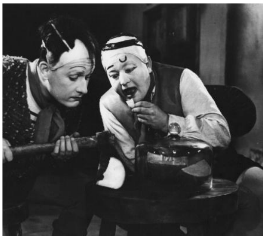
(Jiří Voskovec a Jan Werich)

Jiří Voskovec studoval ve francouzském Dijonu lyceum a poté začal studovat práva v Praze. Jan Werich také původně studoval práva, ale nedostudoval. Poté se začal zajímat především o kulturu. Roku 1939 emigrovali oba do Ameriky. Do Československa se Jan Werich vrátil v roce 1945 a Jiří Voskovec o rok později. Společně založili krátce fungující divadlo V. + W. (1946-1948), kde vystupovali jako dva klauni a vyjadřovali se skrze své rozhovory k politické i kulturní situaci. Po Emigraci Jiřího Voskovce do Francie (1948) a později do USA (1950) se už tato dvojice nikdy nesešla. Jan Werich začal pracovat jako ředitel tehdejšího Divadla satiry (dnes divadlo ABC) a začal jako nová dvojice s Miroslavem Horníčkem.