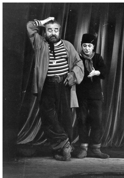
(Jan Werich a Miroslav Horníček)