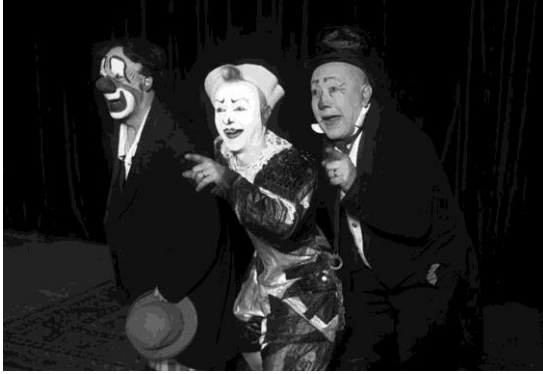
(Albert, Francois a Paul Fratellini)