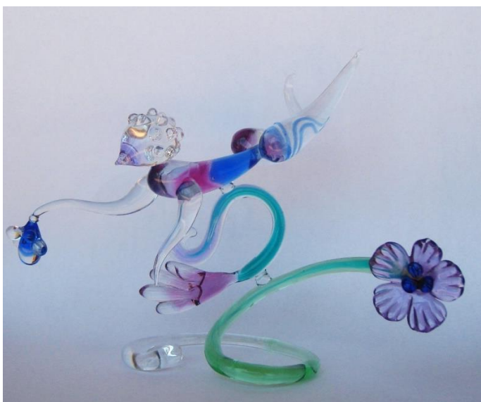
REPLIKA VINUTÉ FIGURKY