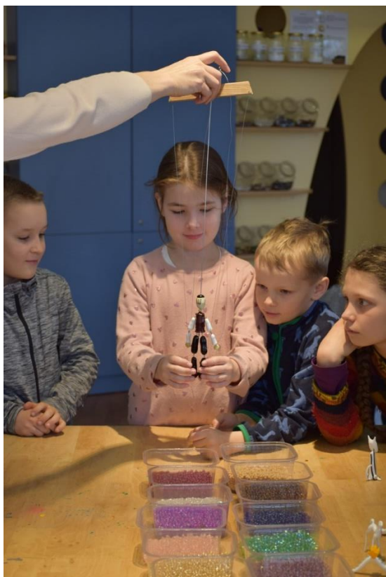
PŘEDSTAVENÍ KRAJÁNKA SKLORÁDA