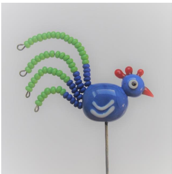
REPLIKA SKLENĚNÉHO ŠPENDLÍKU