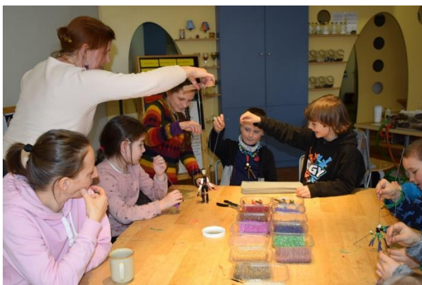
SKLORÁD VÍTÁ NOVÉ KAMARÁDY