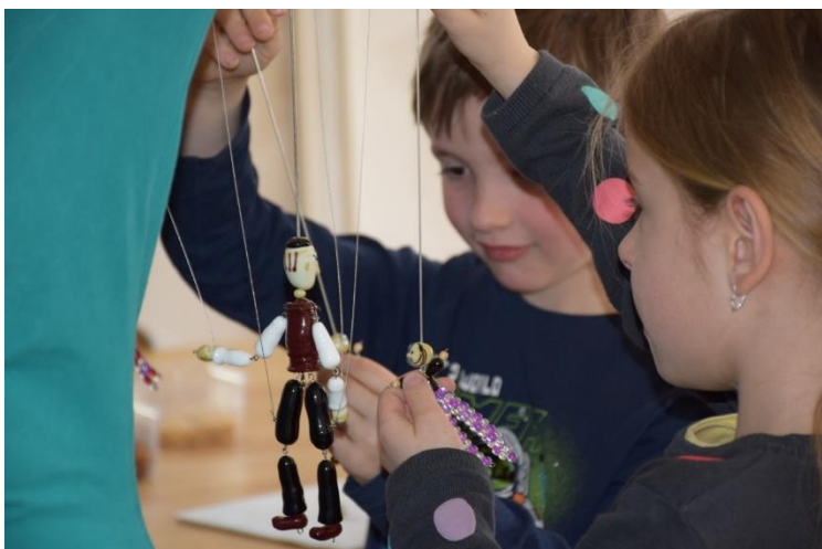
ETUDY LOUTEK SE SKLORÁDEM