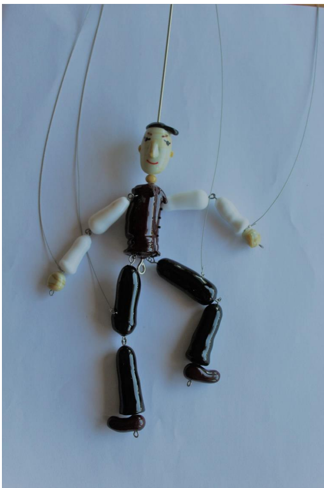
LOUTKA KRAJÁNKA SKLORÁDA