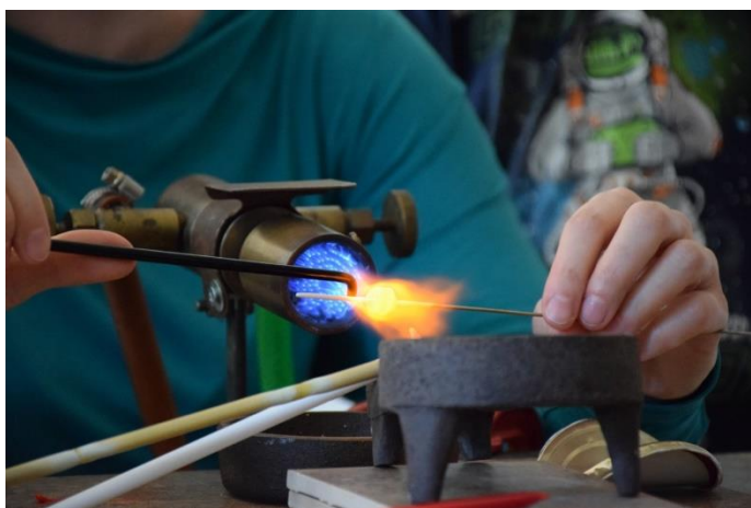
PRÁCE U KAHANU