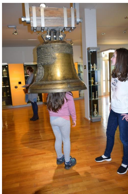
ROZDÁVÁNÍ HLAVIČEK PRO LOUTKY U ZVONU