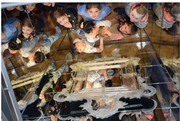
EXPOZICE HISTORICKÉHO SKLA