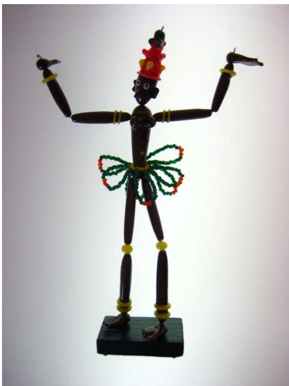
REPLIKA DRÁTKOVÉ FIGURKY