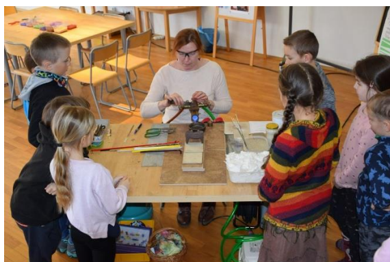
PRÁCE U KAHANU