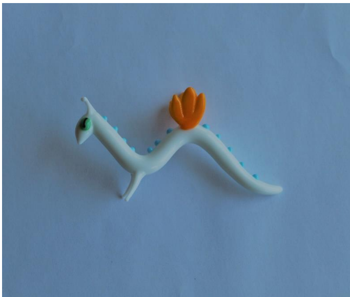
REPLIKA TAŽENÉ FIGURKY