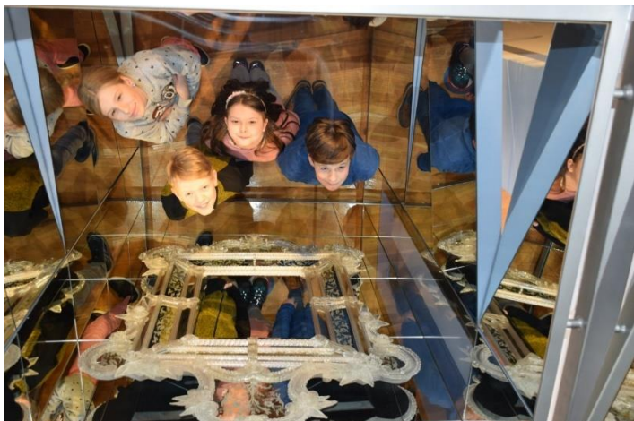
EXPOZICE HISTORICKÉHO SKLA