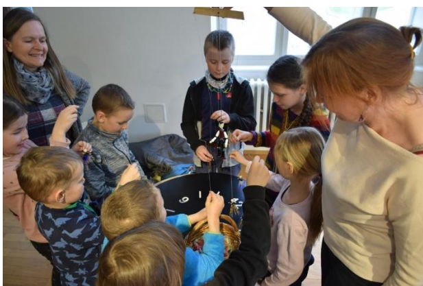
LOUČENÍ SE SKLORÁDEM