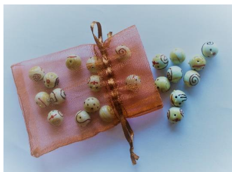
HLAVIČKY NA DĚTSKÉ LOUTKY