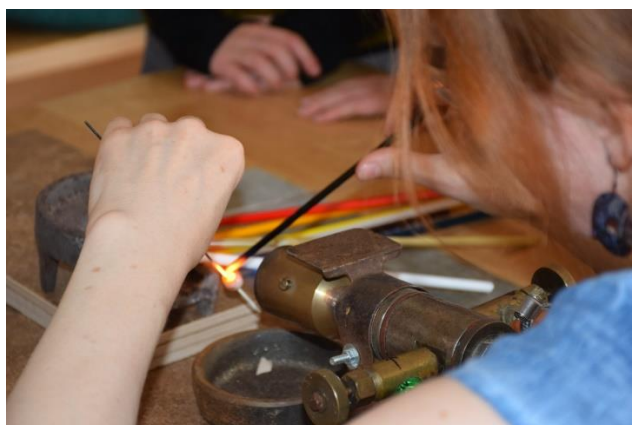
PRÁCE U KAHANU