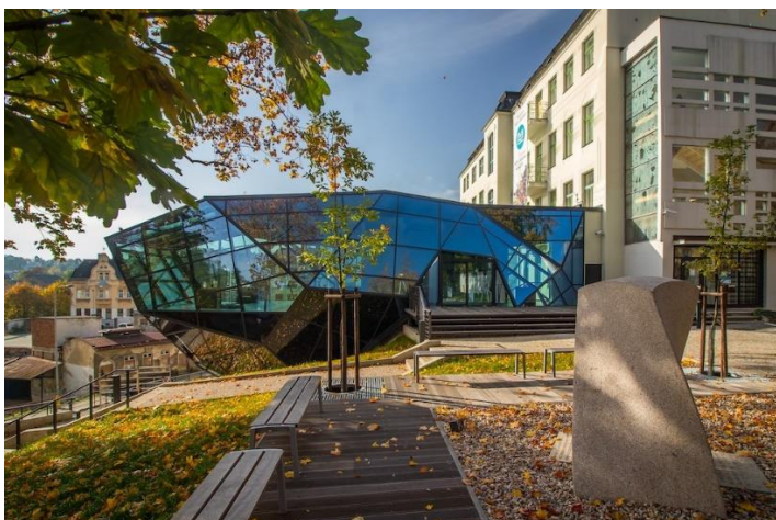
MODERNÍ PŘÍSTAVBA MUZEA