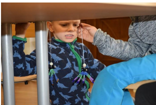
KOMUNIKACE DĚTÍ SKRZE LOUTKU