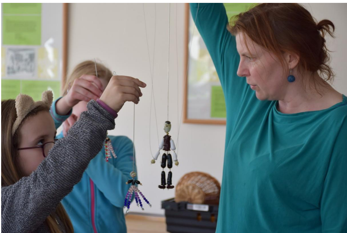
ZÁVĚREČNÉ ROZLOUČENÍ S KRAJÁNKEM SKLORÁDEM