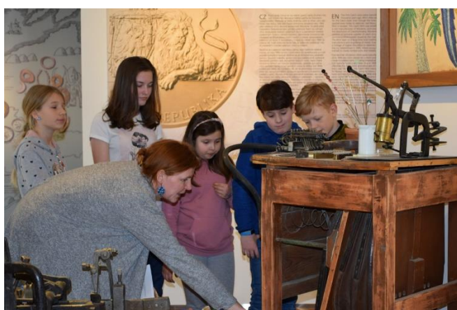
KAHAN SE ŠLAPACÍM MĚCHEM