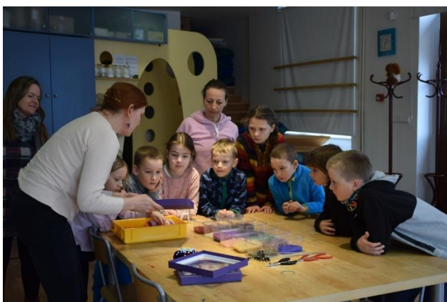
VÝVOJOVÉ FÁZE SKLENĚNÉ FIGURKY