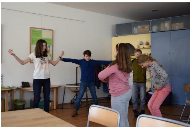
ŽIVÉ OBRAZY VÁNOČNÍCH OZDOB