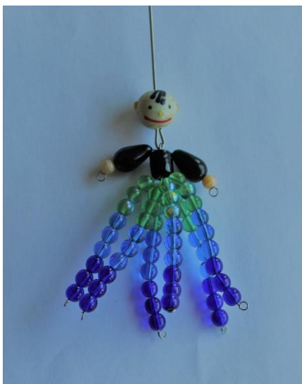
LOUTKA Z RUKODĚLNÉ AKTIVITY