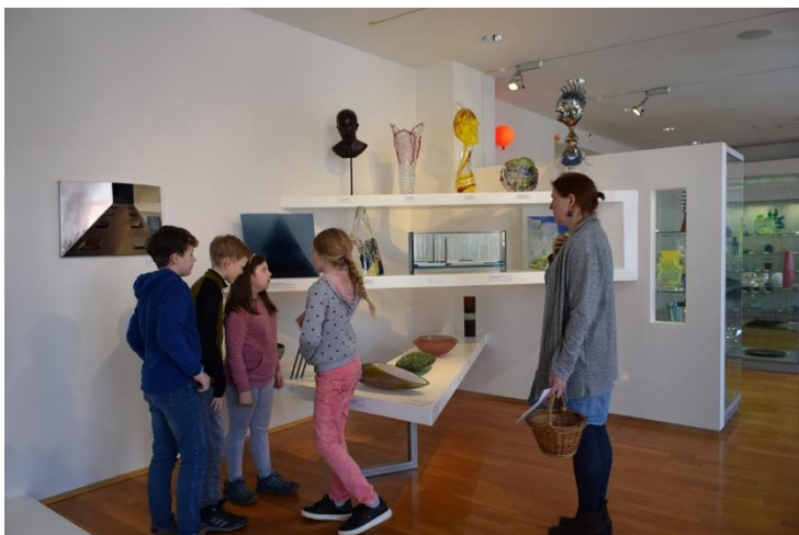
EXPOZICE MODERNÍHO SKLA