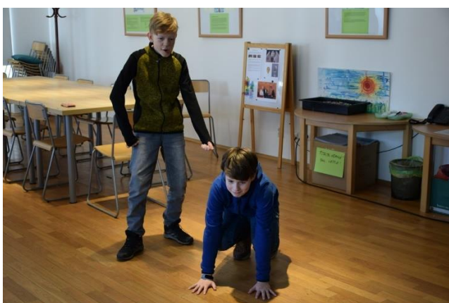
ŽIVÉ OBRAZY CENY „MISS FIGURKA“