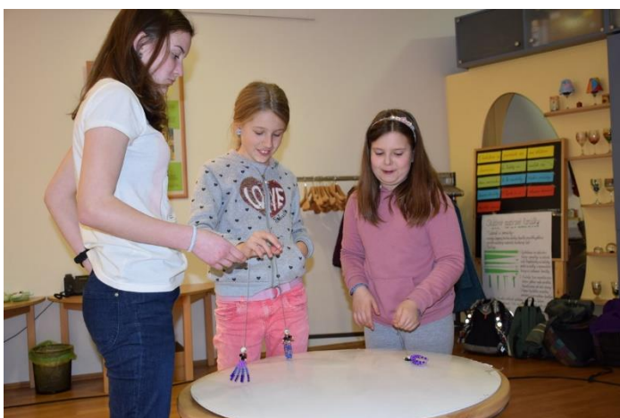
ETUDA S LOUTKOU