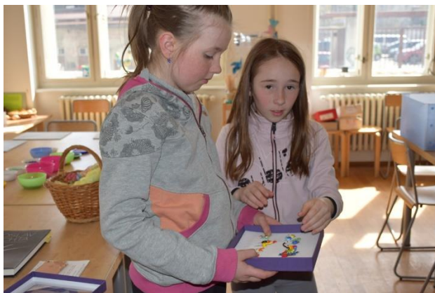
VÝVOJOVÉ FÁZE SKLENĚNÉ FIGURKY