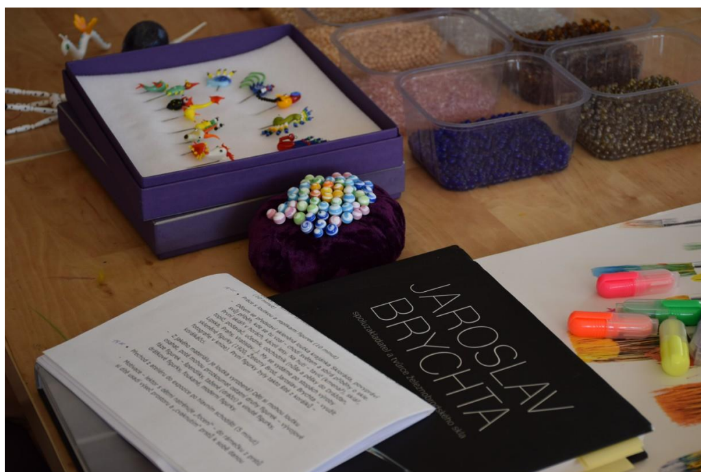
VÝVOJOVÉ FÁZE SKLENĚNÉ FIGURKY