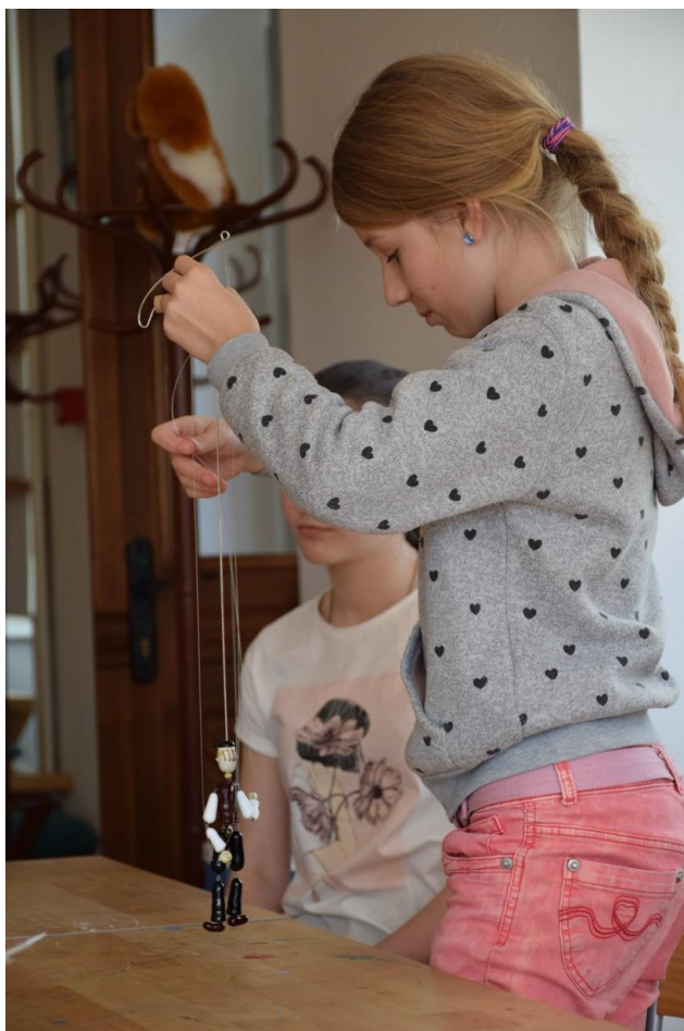
PŘEDSTAVENÍ SKLENĚNÉ LOUTKY