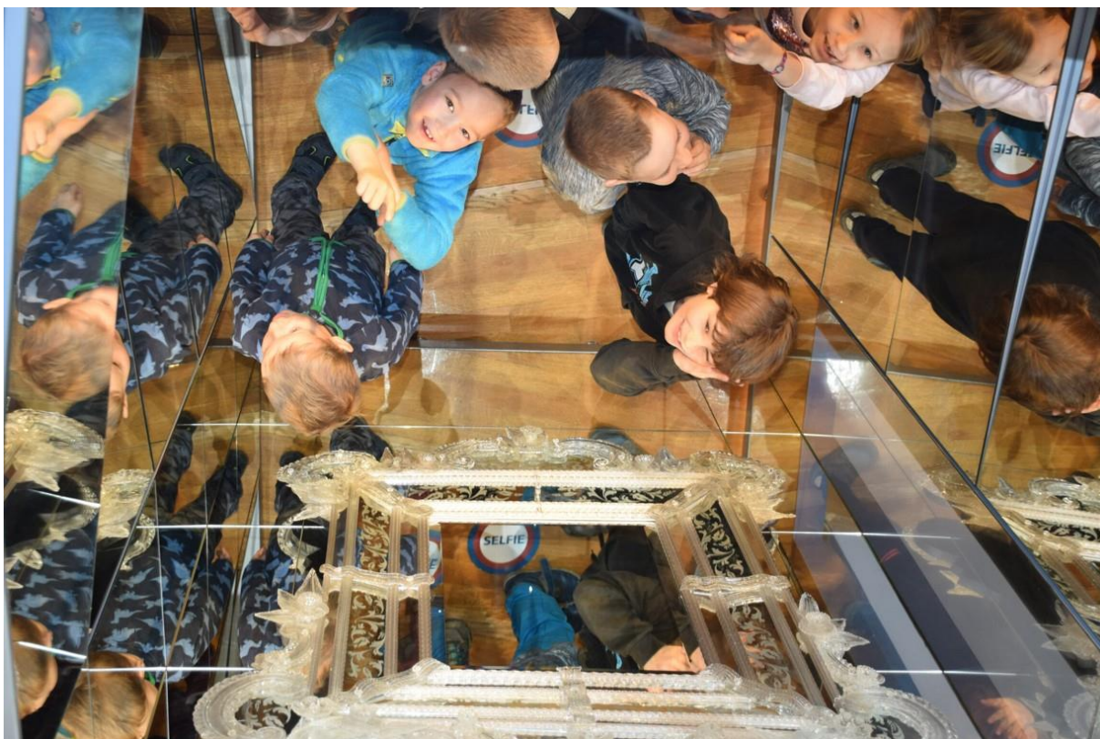
EXPOZICE HISTORICKÉHO SKLA