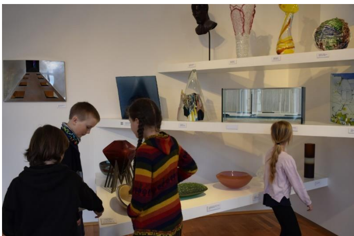
EXPOZICE MODERNÍHO SKLA