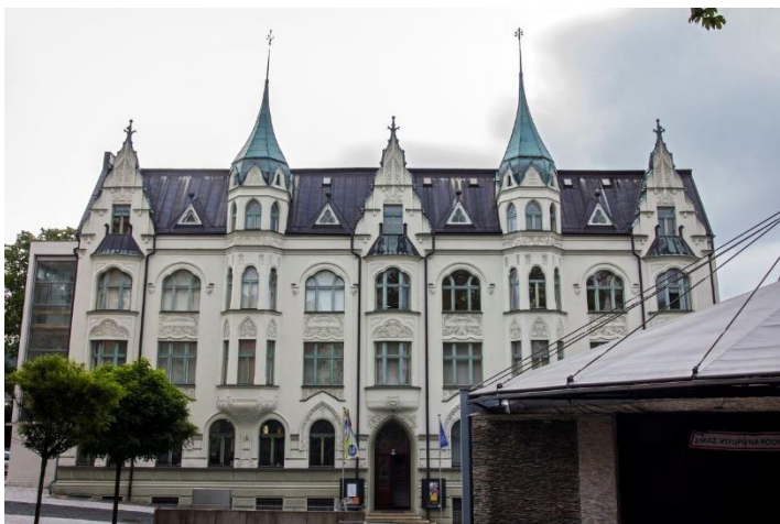
HISTORICKÁ BUDOVA MUZEA