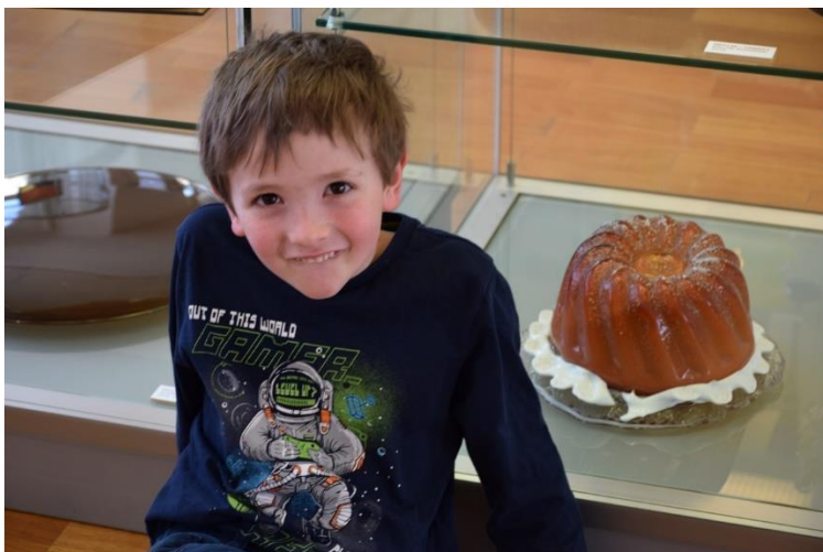
EXPOZICE MODERNÍHO SKLA