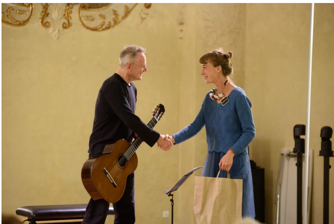
Koncert německého kytaristy Tilmána Hoppstocka.