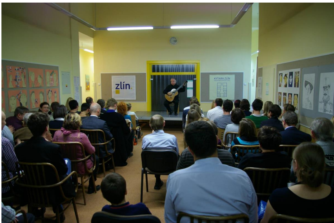
Koncert uruguayského kytaristy Álvara Pierriho.