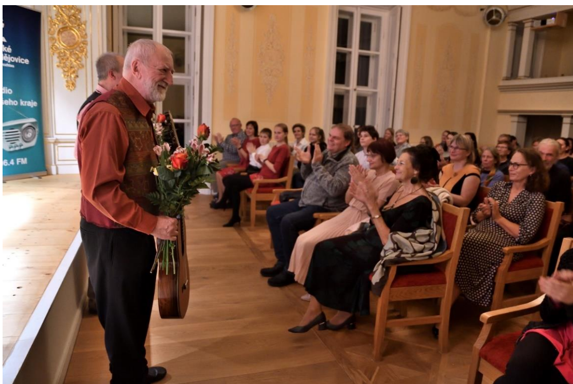
Koncert českého kytaristy Štěpána Raka.