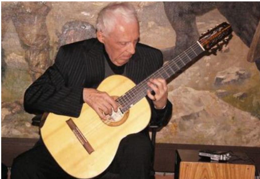
Koncert českého kytaristy Jiřího Jirmala.