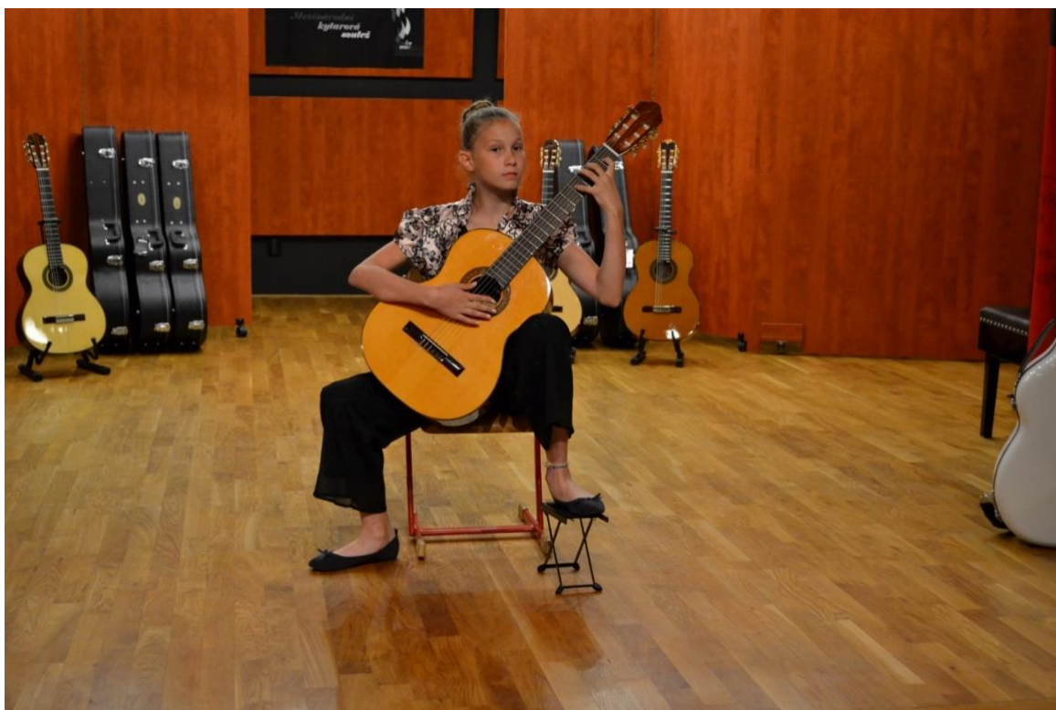
Soutěžící kytarového klání ve Zruči nad Sázavou.