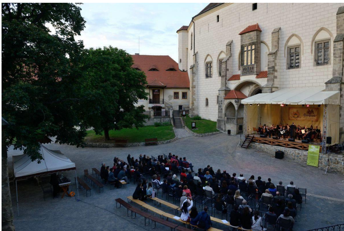
Koncert na nádvoří hradu Křivoklát.