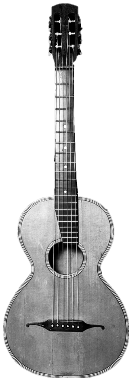
Terciová kytara 19. století – podle Stauffera 46