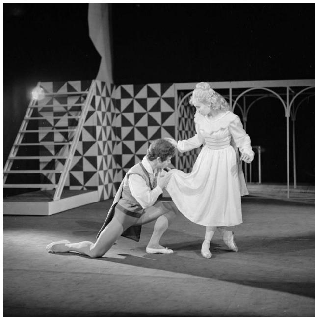
9. Romeo a Julie