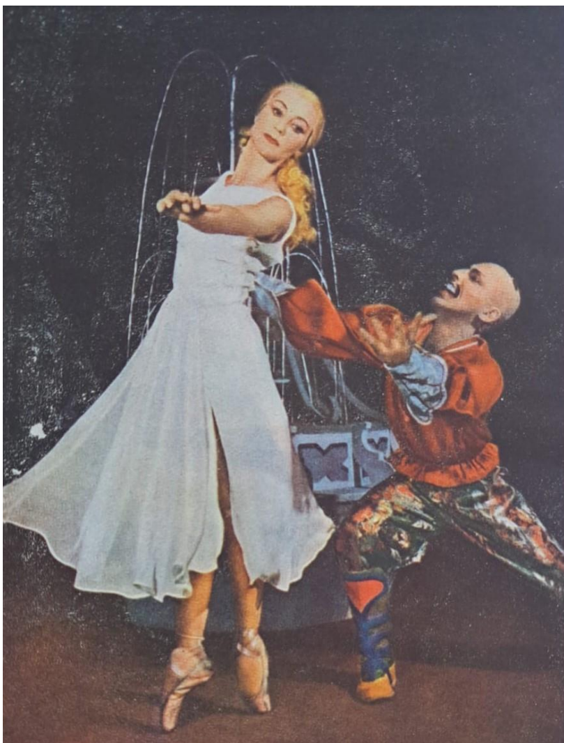
4. Bachčisarajská fontána , V. Vágnerová, R. Karhánek