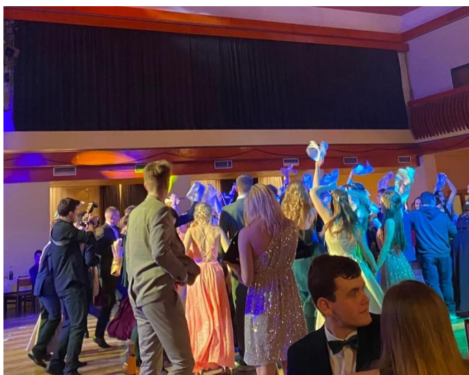
Obrázek 12. Zašlapávání šerp. Ples Lepařova gymnázia v Jičíně, 10. 2. 2023.

Půlnoční překvapení bývá na mnoha plesech posledním bodem programu, po němž následuje bujará párty. V některých městech se však program plesu ukončuje speciálním rituálem, kterému se říká zašlapávání šerp. Při něm se všichni maturanti sejdou na parketě, začne hrát jimi zvolená písnička, oni si sundají svou šerpu, hodí ji na zem a začnou po ní šlapat a skákat. Hodně maturantů a maturantek si však šerpu nechce poničit, a tak si šerpu pouze sundá a během skákání s ní mává nad hlavou (viz obrázek 12). Tento akt jim má přinést štěstí, respektive zažehnat smůlu, kterou jim mohlo přinést to, že se maturanty nazývají ještě před tím, že maturitní zkoušku úspěšně složili. Zašlapávání šerp zároveň mohou maturanti chápat jako tečku za maturitním plesem, který dlouho připravovali a teď je konečně za nimi. Mohou ho vnímat také jako poslední bariéru, která je chránila před realitou maturitní zkoušky, již se od tohoto momentu začne závratně blížit.