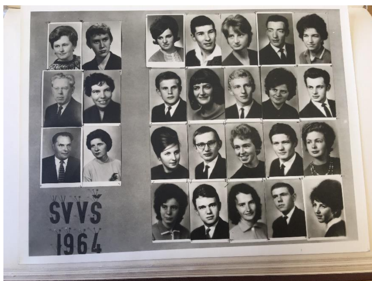
Obrázek 1. Maturitní tabla SVVŠ z roku 1964. Přímo k němu se pojí zajímavá poznámka v kronice: „Maturitní tabla tentokrát nebyla zveřejněna pro celkový nezájem žactva a pro jejich špatnou úpravu.“

Nejkonkrétnější informace se mi podařilo dohledat v pobočce Státního archivu v Českém Krumlově, kde jsem mohla nahlédnout do kronik místního gymnázia, tehdy ještě Střední všeobecně vzdělávací školy. V kronikách z konce 50. let žádné záznamy o maturitních plesech nebyly. Tradicí spojenou s maturitou byly pouze maturitní tabla – tedy nástěnky s fotografiemi maturantů a třídních učitelů (viz obrázek 1)