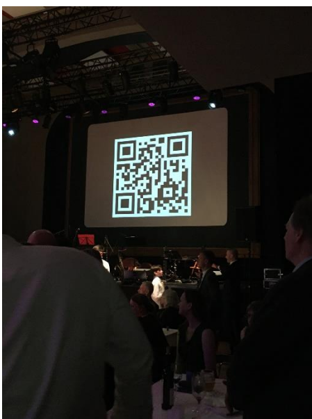
Obrázek 11. Zlatý déšť. Alternativa v podobě QR kódu pro návštěvníky, kteří u sebe nemají mince. Maturitní ples Gymnázia Mensa v Praze, 17. 2. 2023.

Rituál zlatého deště probíhá tak, že maturanti přes celý taneční parket natáhnou velkou plachtu libovolného tvaru a barvy, všichni ji drží za její okraje tak, aby vlála ve vzduchu. S plachtou začnou mávat nahoru a dolů takovým způsobem, že se plachta rozvlní. V tu chvíli začnou diváci plesu házet směrem do plachty drobné mince, které o sebe různě naráží a cinkají. Nasbírané peníze mohou mít různý význam a užitek. Ten první je naprosto praktický, peníze se chápou jako výdělek, který se použije buď na doplacení výdajů plesu, nebo se utratí při maturitním večírku. Takový přístup měli i maturanti Gymnázia Mensa, kteří kromě samotného sbírání peněz do plachty dali možnost lidem udělat platbu pomocí QR kódu, který se objevil na projekčním plátnu (viz obrázek 11).