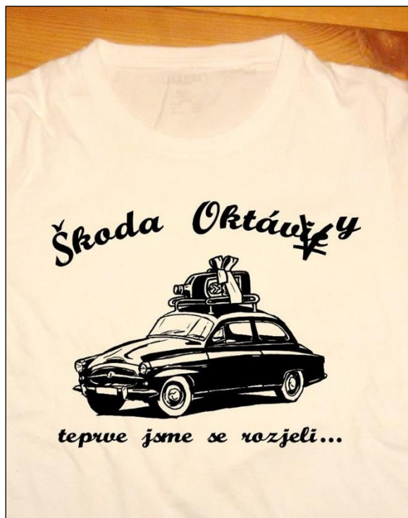
Obrázek 13, vlevo. Návrh na maturitní tričko mé třídy, který vyvolal největší spor v průběhu příprav maturitního plesu.