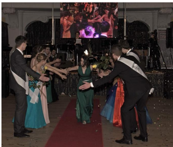
Obrázek 6. Šerpování, maturantka procházející špalírem po červeném koberci. Maturitní ples Gymnázia Český Krumlov, Český Krumlov 13. 1. 2017.

Studenti svou chůzi slávy často doplní jednoduchým tanečkem, nebo se objímají s okolo stojícími spolužáky či se letmo dotýkají jejich napřažených dlaní ( viz obrázek 6 ).