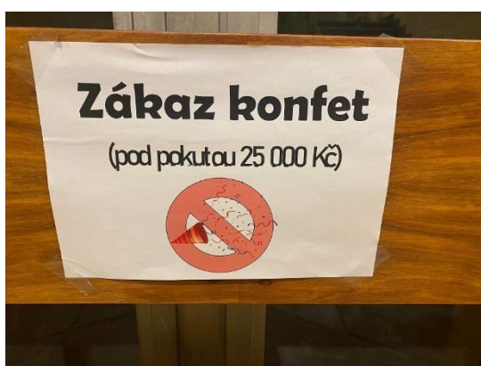
Obrázek 10. Cedule upozorňující návštěvníky plesu na zákaz vystřelování konfet. Ples Lepařova gymnázia, Jičín, 10. 2. 2023