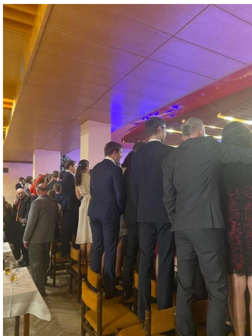
Obrázek 5. Lidé stojící na židlích pro lepší výhled. Maturitní ples Lepařova gymnázia v Jičíně, 10. 2. 2023

Diváci při nástupu maturantů většinou utvoří stojící dav kolem tanečního parketu, aby byli dění na tanečním parketu co nejbliže. „ Nemám nic proti tomu, aby si stoupli na židle, ale prosím vás, budou zutý, “ upozorňuje člen ochranky na plese poděbradské střední školy maturanty, protože má zkušenost s tím, že lidé bojují o dobrý výhled i tak, že si stoupnou na židle nebo stoly. Nejvýraznější zkušenost v tomto ohledu mám z maturitního plesu Lepařova gymnázia v Jičíně, kde se kolem parketu vytvářely velké tlačence a lidé si na židle stoupali i na balkonech (viz obrázek 5). Celý nástup bývá provázen velkými ovacemi, které následují téměř po každém tanečním prvku, fanděním a výkřiky jmen konkrétních maturantů. Po nástupu maturantů je v programu pouze malá prodleva a přichází nejdůležitější část programu – a také nejhlavnější rituál celého plesu – šerpování maturantů.