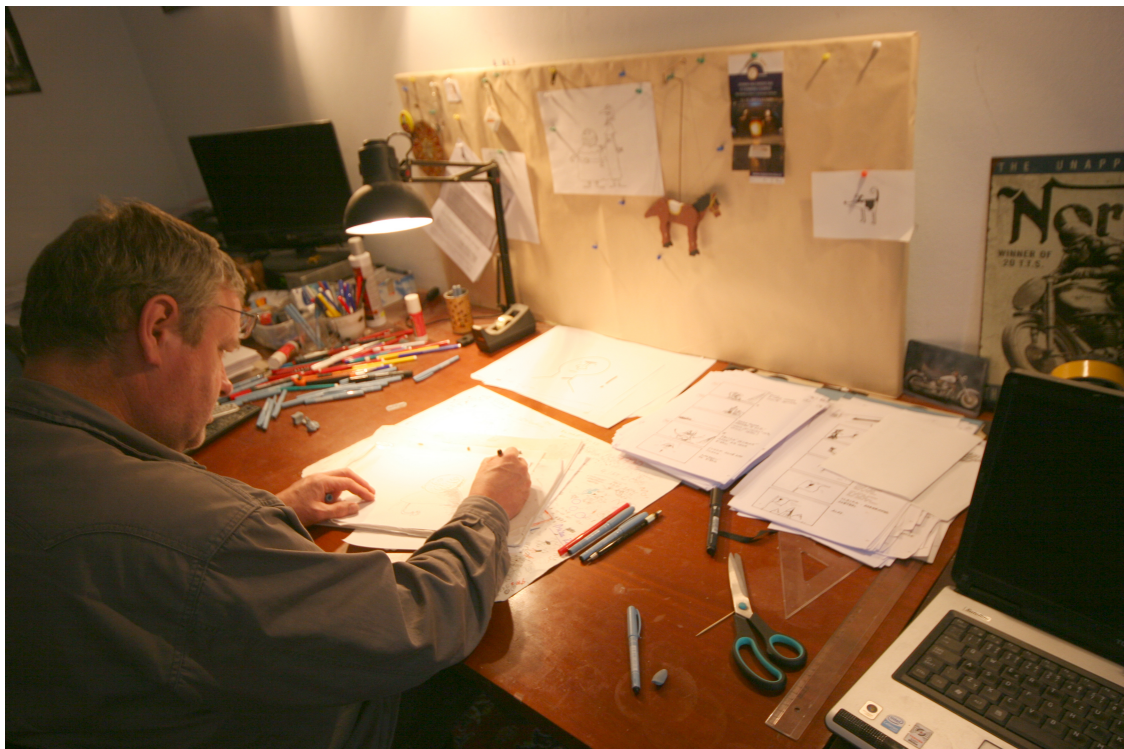
3/ Pavel Koutský, Praha, Kampa 27. 8. 2013