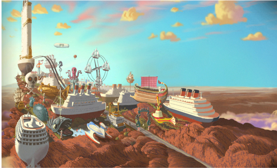
1/ Futurologický kongres, režie Ari Folman, 2013