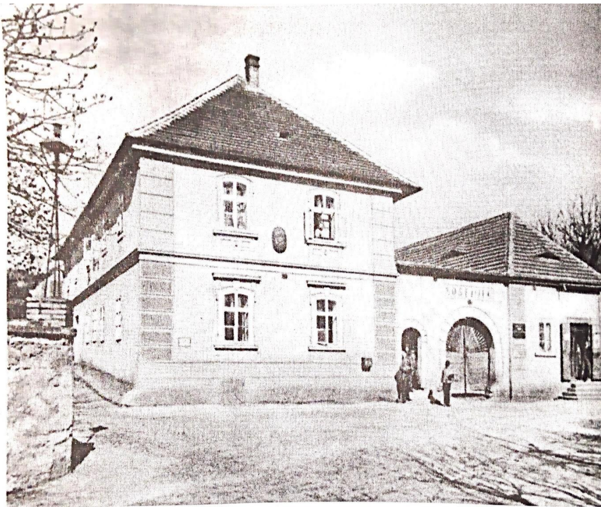
Obr. č. 3 Rodný dům A. Dvořáka v Nelahozevsi

Josef Bohuslav Foerster o Antonínu Dvořákovi napsal: „ Neznám mezi žijícími skladateli hudebními jména, jež by dovedlo jako toto rozechvěti veškeré struny mého nitra. Antonín Dvořák! Podléhám naprosto a rád opojivému zvuku jeho lyry, ztrácím všechnu schopnost kritisovati, slyším-li jeho skladby, a stávám se jen posluchačem, jenž až do posledních výběžků svých nervů spolucítí, jenž spolu zpívá, jásá, pláče a sní, nepocituje pro okamžiky břemenažití a jeho nekonečného smutku... “. 4