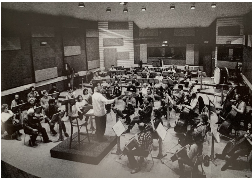
Obr. 1.3 Zkouška Plzeňského rozhlasového orchestru v rozhlasovém studiu 13

V roce 1998 přijal orchestr zpátky název Plzeňská filharmonie a stal se obecně prospěšnou společností. Oficiálním zakladatelem je město Plzeň.