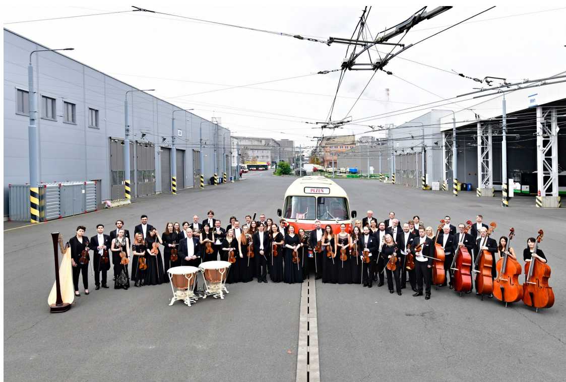
Obr. 2.1 Plzeňská filharmonie v roce 2022 16

Orchestr nabízí svým posluchačům různé abonentní řady. Jsou to řady Diamant, Platina, Crossover, Duha, Chrám a Kruh přátel hudby. Každá z těchto abonentních řad se zaměřuje na jiný žánr, od klasické hudby přes hudbu filmovou či populární až po dětské koncerty. Zajímavou činností Plzeňské filharmonie jsou právě koncerty pro mladé posluchače se vzdělávacím programem. Tyto koncerty pořádá orchestr pro žáky mateřských i základních škol. Pro mladé talentované umělce ze základních uměleckých škol a konzervatoří pořádá Plzeňská filharmonie projekt Muzikantská naděje. Během tohoto projektu mladí muzikanti nastudují vybraná díla se stálými členy orchestru pod taktovkou Chuheie Iwasakiho, a pak je společně provedou na koncertě. Děti tak mají možnost proniknout do světa profesionálních hudebníků a nabírají cenné zkušenosti. V současné době je orchestr finančně podporován statutárním městem Plzeň, Plzeňským krajem a Ministerstvem kultury České republiky. 15