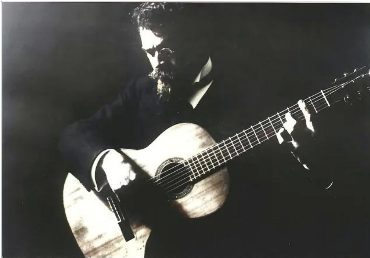
Francisco Tárrega hrající na kytaru Enriquea Garcii No. 43 1904