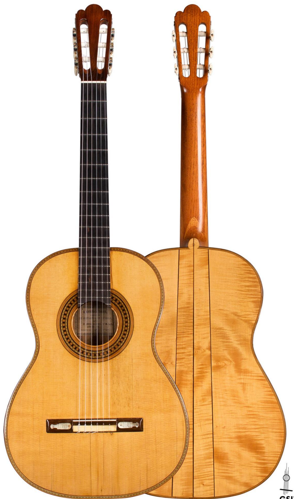
Antonio de Torres SE 49 1883