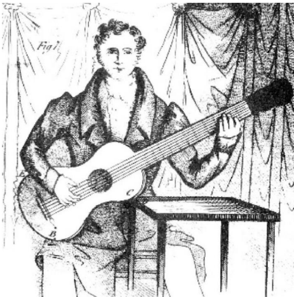
Sorova metoda založená na opření kytary o roh stolu.