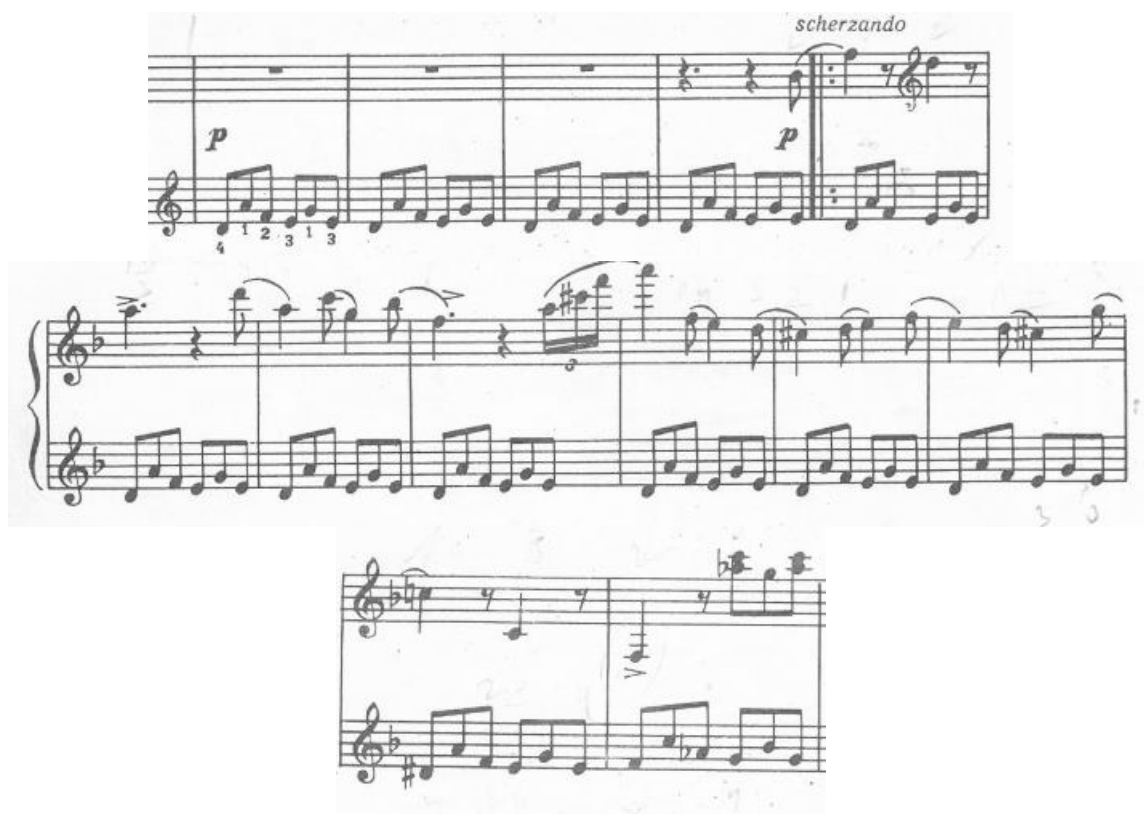
Obrázek 8: S. Prokofjev: Klavírní sonáta č. 2, 4. věta [11]

V šestnácté sarkastické variaci Adama Skoumala je naprosto zřejmě znát rukopis Sergeje Prokofjeva. Ve čtvrté větě jeho druhé klavírní sonáty se vyskytuje vedlejší téma postavené na naprosto stejném principu.