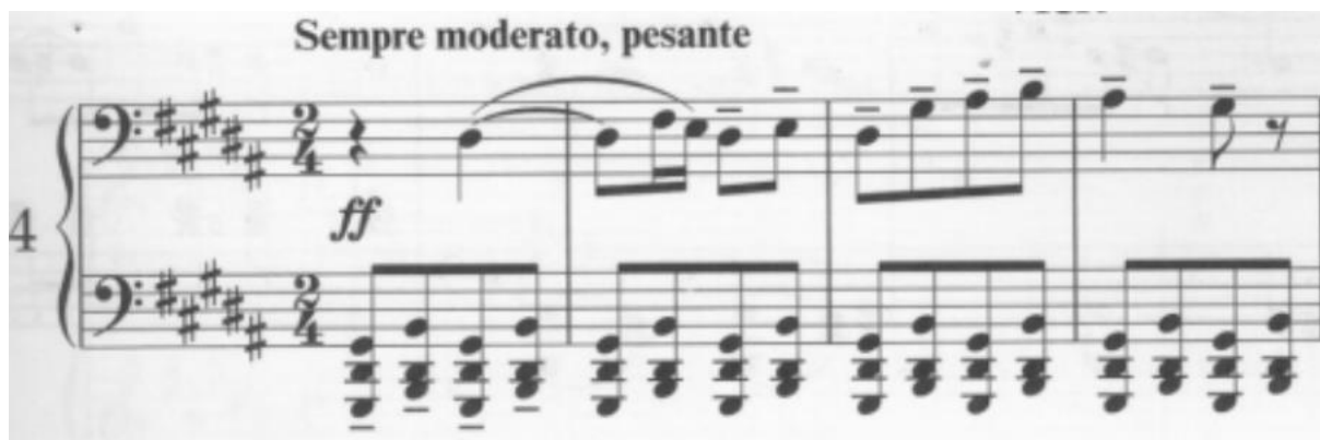
Obrázek 6: M. P. Musorgskij: Obrázky z výstavy (Bydlo) [9]

Patnáctá variace může v posluchači evokovat část nejen pochmurnou náladou, ale hlavně stylizací levé ruky čtvrtou část Obrázků z výstavy Modesta Petroviče Musorgskijho, totiž část Bydlo.