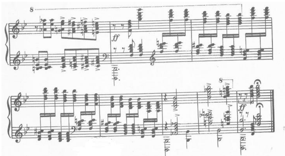
Obrázek 12: S. Rachmaninov: Klavírní sonáta č. 2 b moll (4. věta) [10]

Závěr celé kompozice se opět vrací k dílu Sergeje Rachmaninova. Ukončení Variací na lidovou píseň poukazuje i na závěr Rachmaninovy klavírní sonáty b moll.