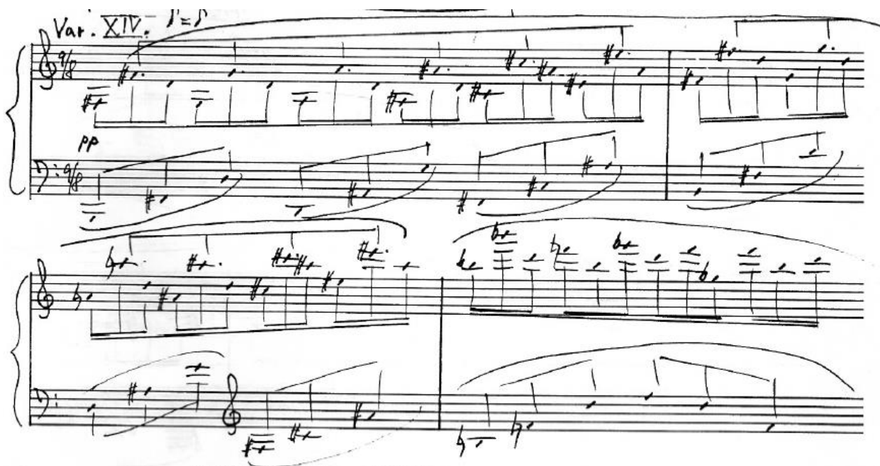
Obrázek 5: A. Skoumal: Variace na lidovou píseň (14. variace) [7]

Ve čtrnácté variaci nedochází sice k citaci konkrétní skladby, ale autor zde jasně v barvách a harmoniích napodobuje tvorbu Maurice Ravela.