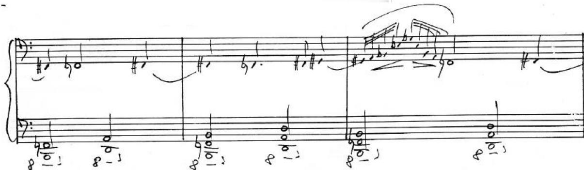
Obrázek 7: A. Skoumal: Variace lidovou píseň (15. variace) [7]