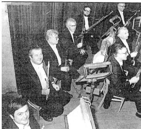
Obrázek č. 4: Flétnista v orchestřišti DJKT – při představení Smetanovy Prodané nevěsty, listopad 1980 (v zadní řadě druhý zleva)

Bohumír Liška patřil k dirigentům, kteří Vojtěcha Lindaura pozitivně ovlivnili a k nimž podle dochovaných svědectví choval velkou úctu (dirigent flétnistu také vyzval a inspiroval k účasti na dalších kulturních projektech). Bohumír Liška nastoupil na post šéfa plzeňské opery z brněnského angažmá v roce 1955 a setrval až do svého odchodu do Prahy v roce 1967. Za jeho působení byl na plzeňských jevištích uváděn na svou dobu progresivní a zajímavý program, který místní operu posunul mezi přední české scény - to také jistě