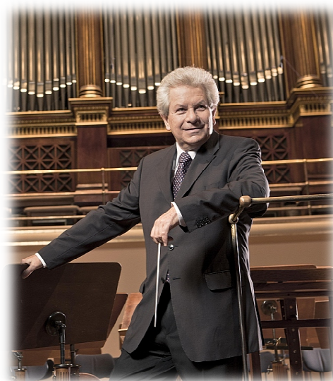
Obrázek 2 – Jiří Bělohlávek

Jiřího v jeho hudebních začátcích. Ve čtyřech letech se začal učit hrát na klavír a zpíval