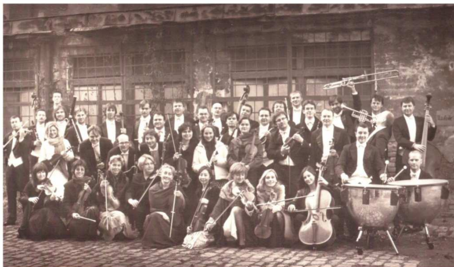
foto v propagační brožůře pro sezónu 2007/08