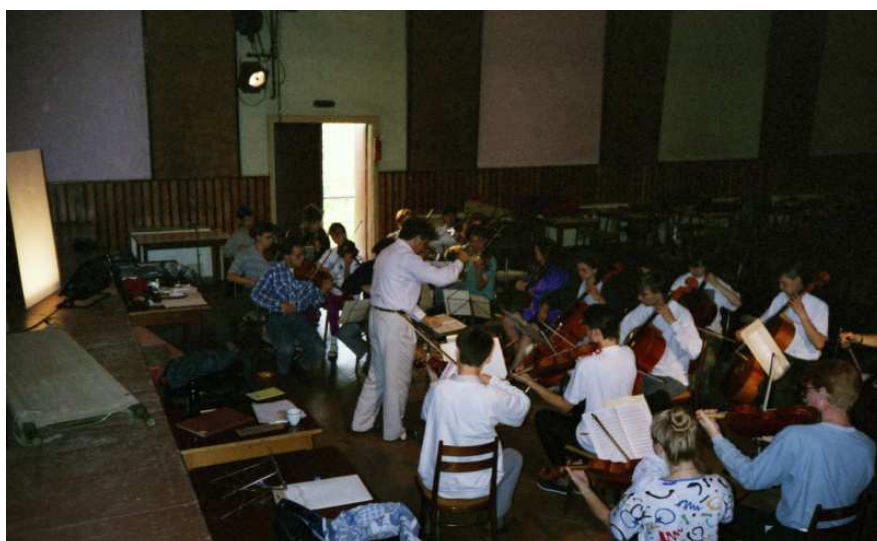
soustředění Machov 1992