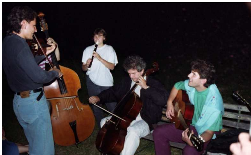
soustředění Machov 1992