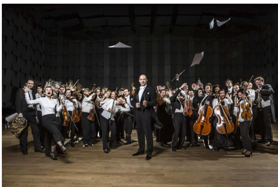
foto pro novou sezónu 2015/2016