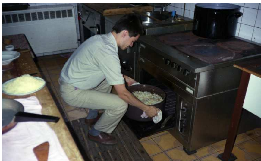
soustředění Machov 1992