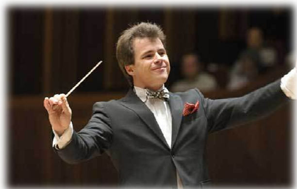
Obrázek 4 - Jakub Hrůša

Brněnský rodák, kterého v roce 2011 časopis Gramophone zařadil mezi elitu mladých světových dirigentů, které čeká hvězdná budoucnost, se řadí mezi představitele mladé české dirigentské generace. V současné době je šéfdirigentem Bamberských symfoniků, hlavním hostujícím dirigentem Metropolitního symfonického orchestru v Tokiu a