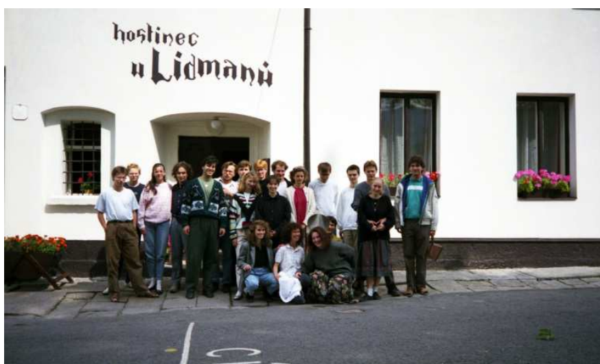
soustředění Machov 1992