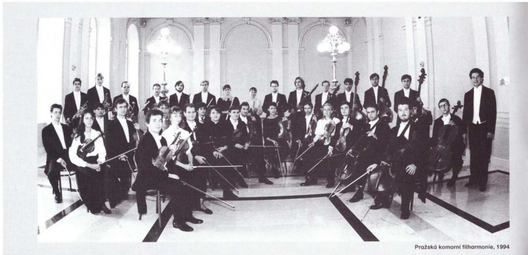
Pražská komorní filharmonie, 1994