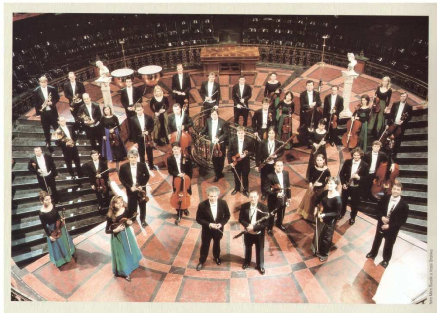
© Miroslav Štěpánek / Vlastislav Dvořák