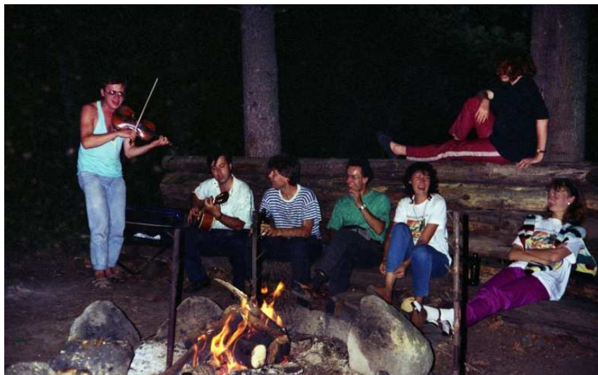
soustředění Machov 1992