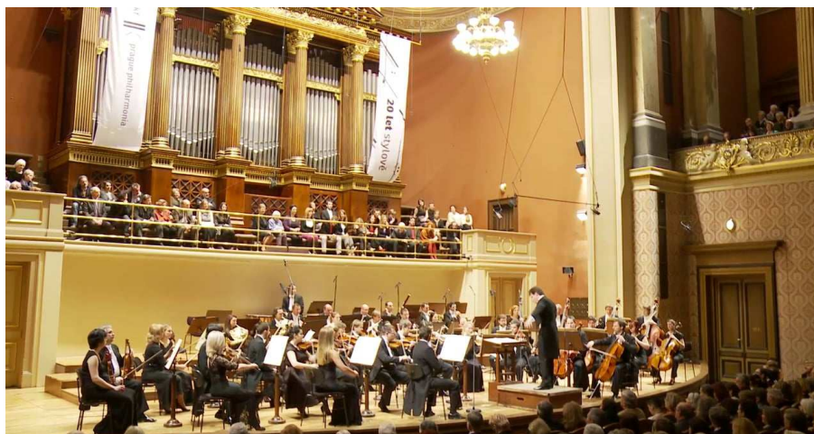
koncert 18. 1. 2015 s dirigentem Jakubem Hrušou