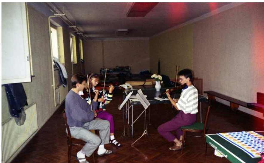
soustředění Machov 1992