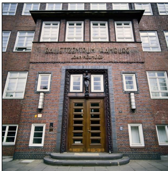
Budova Baletního centra Hamburk – John Neumeier