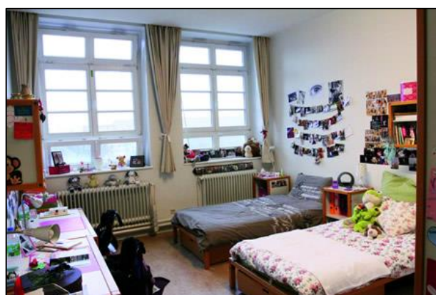
Ložnice v internátu