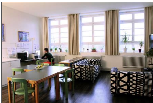
Společenská místnost internátu, zdroj: http://hamburgballett.de/e/internat.htm