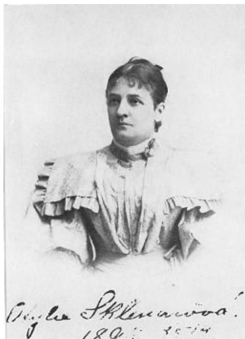
Příloha č. 15 105