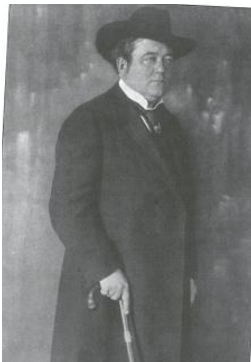
Příloha č. 7 97