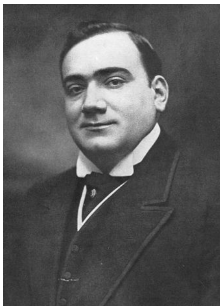
Příloha č. 9 99