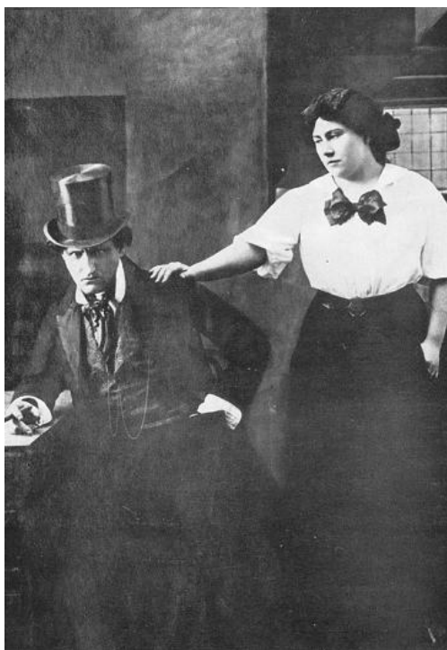
Příloha č. 11 101