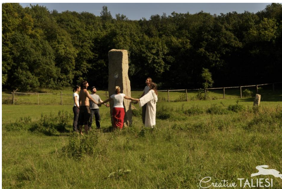
Obrázek 18 - Uctívání a vnímání přírody

může být rozmlouvání se silou, kterou nevidíme a nemůžeme ani pojmenovat, ale přesto jsme od této síly nebyli nikdy odděleni."