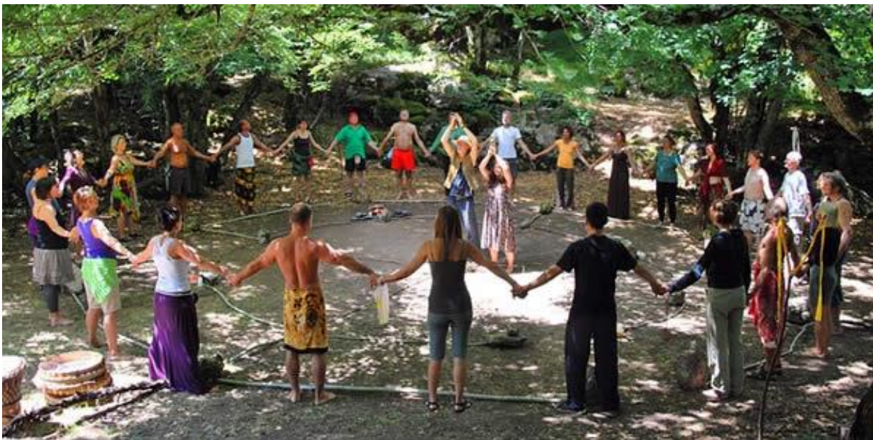
Obrázek 20 - Wicca dnes

Tanec trvá tak dlouho, dokud nejsou všechny stuhy kolem májky spleteny. Celá tato ceremonie symbolizuje spojení muže a ženy a vzájemné propojení všech účastníků."