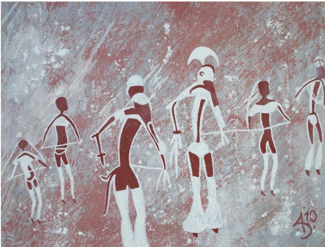
Obrázek 5 - Rituální tanec masek - Sahara