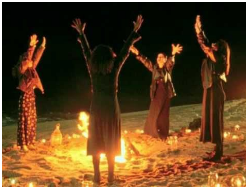
Obrázek 12 - Wiccanský rituál vzývání světových stran

Po skončení veškeré rituální činnosti a vykonání magické práce, je kruh zrušen poděkováním všem entitám a božstvům, které byly k rituálu povolány a zhasnutím svíci světových stran. Po tomto všem je zvykem, aby se společnost ještě zdržela na malou veselou oslavu, kde se tanec stává součástí. Většinou se tančí skupinové tance v kruhu, nebo tance řadové. Účastníci se vzájemně proplétají a do rytmu improvizují – tento tanec nemá žádné předpisy a je brán jako forma zábavy.