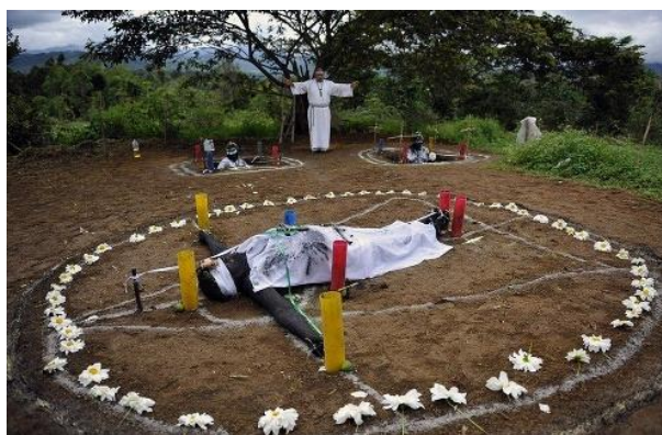
Obrázek 10 - Příprava obětí k vyléčení