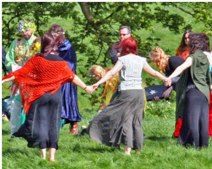
Obrázek 15 - Tanec při příležitosti pohřbů

K oslavám wiccanského kruhu patří i oslavy životních změn. Všechny tyto významné okamžiky v životě jedince, nebo rodiny, mají důležitou roli v této wiccanské komunitě. Ať už to jsou oslavy narození, úmrtí, nebo sňatků. Nejznámější obřad, je obřad Spojení rukou. Tento ceremoniál není k uzavření sňatku, ale pouze k vytvoření pouta uznávaného wiccany. Jestliže se pár rozhodne pouto zrušit, může být pouto zrušeno wiccanskou ceremonií Rozdělení rukou. Barevná páska, která dává pár dohromady je spletena ze tří vláken. Tyto tři vlákna symbolizují nevěstu, ženicha a jejich vztah. Děti, které se čarodějnicím a čarodějům narodí, jsou představovány v obřadu nazvaném Žehnání dětí. Součástí těchto oslav je zasazení stromu a tanec kolem něj. 104