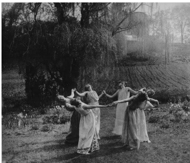
Obrázek 13 - Oslava svátku Samhain

Tento svátek se označuje jako „Nový rok čarodějnice“ Podle legendy se otvírají kouzelné kopce a s nimi i nové možnosti. V tomto období se prolíná svět živých a svět mrtvých. V podvečer tohoto svátku wiccané vzpomínají na ty, které milovali. Jelikož jako čarodějnice věří v reinkarnaci, věří, že je milovaní neopustili a jejich duše je stále přítomna. Samhain se považuje za poslední slavnost žní a za největší svátek kola roku. Rituální bubnování, nebo regresní meditace tak můžou používat pro získání pozitivní energie. Čarodějnice zakopávají jablka do země, aby si zajistily hojnost po následující zimní měsíce. 99