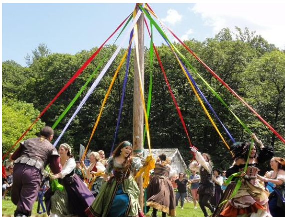
Obrázek 14 - Oslavy při příležitosti svátku Beltane

Tento svátek je na opačné straně kruhu, než Samhain. Jestliže je Samhain oslavou smrti, Beltane je oslavou znovuzrození a považuje se za druhý největší svátek ze všech osmi ceremonií. Je to svátek ohňů a požehnání. Čarodějnice uctívají kmen z vánočního stromku a používají jej jako májku. 102 Na vrchol májky upevní bílé a červené stuhy, které vlají v jarním větříku. Tanečníci je pak za doprovodu živé hudby, řehtaček, nebo bubnů omotávají kolem májky. Červené stuhy se omotávají ve směru hodinových ručiček a bílé naopak. Čarodějnice věří, že tato oslava přináší do života bezpečnost, štědrost a prosperitu. V oslavách Beltaine hraje hlavní roli romantika, láska, smích, písně a tanec.