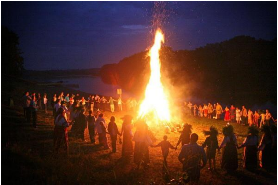
Obrázek 16 - Wiccanské oslavy ohňů