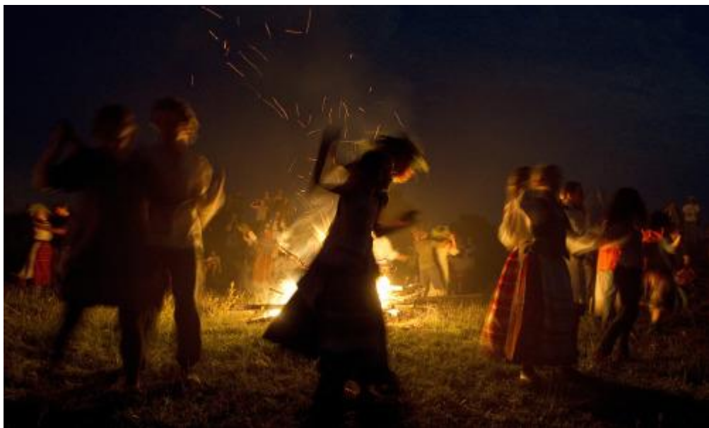
Obrázek 17 - Oslavy Svatojánské noci