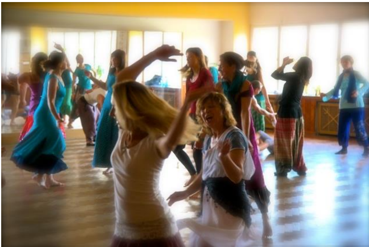
Obrázek 22 - Tanec 5 rytů

„Každá forma prožitkového tance je technikou, která tvoří spojení mezi meditací, uměním, terapií, šamanským léčením, čarodějným rituálem a duchovním impulsem. Prožitkový tanec má kořeny v původních tradicích ve smyslu ožívání a spojení s vlastní energií v tanci. Je to rituál tělesného, duševního i duchovního prožitku sebe sama. Je to taneční rituál oslavy života.“ 116