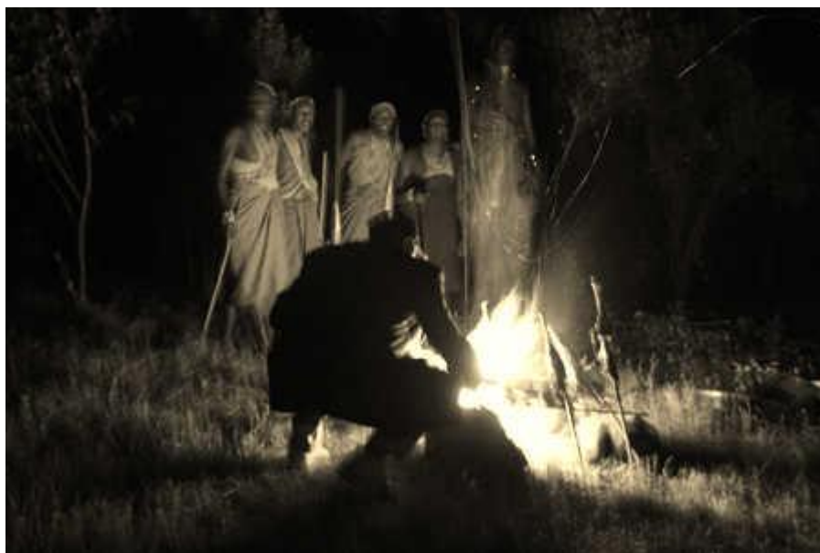
Obrázek 2 - Obřad kmene Masajů

přítomným důvod své cesty a prohlásil jsem, že nechci nikomu způsobit zlo a že nejsem žádný odborník na ou-tchaoui (černou magii). Sultánův vyslanec se chopil druhého ucha a slíbil v zastoupení svého pána, že nám nezpůsobí žádné zlo a poskytne nám potraviny. V případě krádeže nám budou odcizené předměty vráceny. Pak je zvíře obětováno. Z čela mu odejmou proužek kůže, do něhož učiní dva řezy. Svahilec ho vzal do rukou, pětkrát vložil jeden z mých prstů do spodního otvoru, který mi nakonec navlékl až přes článek prstu, kde jsem si ho nechal, při čemž jsem poslovým prstem opakoval stejný obřad v horním otvoru. Po skončení operace proužek přeřízli na dva kusy, na prstě každého z nás zůstala polovina. Teď je sultán z Chiry bratrem bílého cestovatele." 10