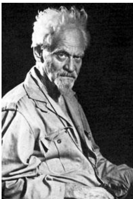
Obrázek 11 - Gerald Brousseau Gardner

román s názvem High Magic's Aid , kde se objevovaly prvky obřadní magie, pohanství a čarodějnictví a měl se zároveň stát vlajkou wiccanského hnutí. 93