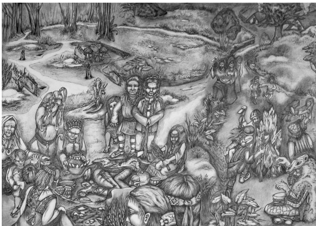
Obrázek 3 - Umělecká imaginace pohřebního rituálu v neolické komunitě

Struktura průběhu všech pohřebních rituálu je většinou velmi podobného charakteru. Mezi odlučovací rituály patří různé způsoby. Jako příklad můžeme uvést ničení majetku, očištění pozůstatku zemřelého, zabíjení zvířat. V přijímacích rituálech se často setkáváme s hostinou pořádanou těsně po pohřbu, nebo oslavy tancem u indiánských kmenů. 24