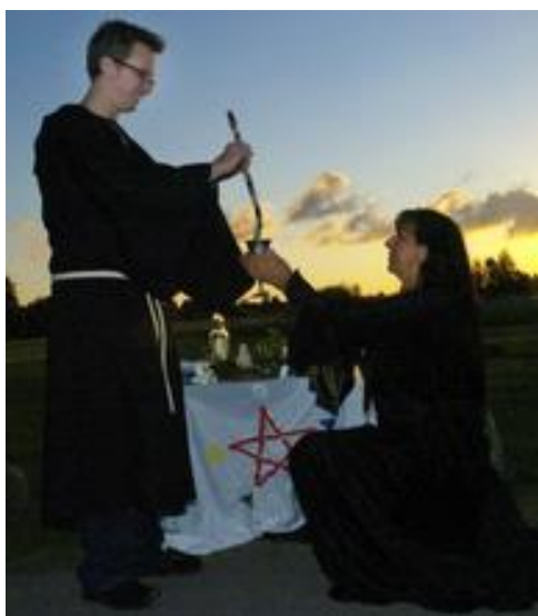
Obrázek 21 - Wiccanský rituál zasvěcení

Z rozhovoru i mé vlastní zkušenosti vyplývá, že i zde je tanec neoddělitelnou složkou podporující rituály a ceremoniály. Stává se součástí všech oslav i smutných okamžiků a pomáhá lidem najít způsob, jak se vyjádřit a vzájemně na sebe působit.