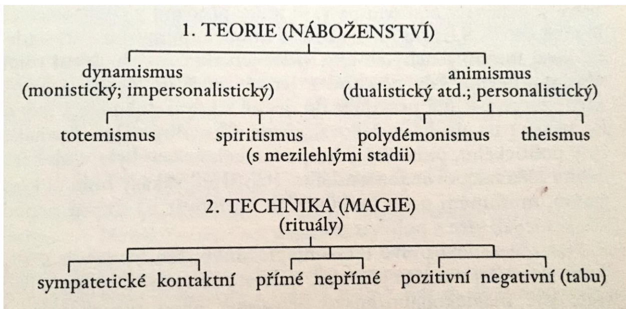
Obrázek 1 - Přehledné schéma magie

Jako příklad si můžeme říct Gennepovu teorii: „ Nejí-li těhotná žena ostružiny, protože by to poznamenalo dítě, provádí negativní přímý kontaktní dynamistický rituál: věnuje-li námořník, který unikl záhubě, Panně Marii jako ex-voto malou loď, jde o pozitivní nepřímý sympatetický animistický rituál. “ 5 Není jednoduché správně rituál definovat. I jedna interpretace může platit pro více rituálů.