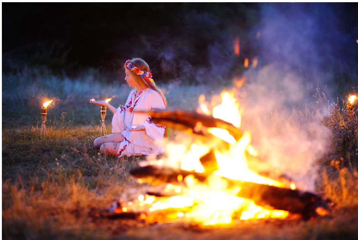
Obrázek 7 - Slavnosti slunce v Bystřici nad Perštějnem

Jeden z mnoha dalších příkladů oslav roku jsou slavnosti ohně v Evropě. Zapalování ohně v den slunovratu, nebo večer předtím bylo běžné po celém Španělsku a na některých místech v Itálii a Sicílii. Lidé zapalovali ohně a tančili kolem nich, někteří jej dokonce přeskakovali. Na Kalymnu se tento rituál ohně prováděl za účelem hojnosti. Tanečníci s kameny na hlavách tančili kolem ohňů a skákali přes žhnoucí uhlíky. Po obřadu se koupali v moři. 56