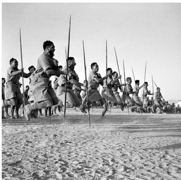
Obrázek 6 - Tanec HAKA v Egyptě v roce 1941

Objevily se také tance, které sjednocovaly kmeny a uržovaly soudružnost. Severozápadní indiánské kmeny tančily Tanec slunce, který pro ně znamenal očištění a léčebnou ceremonii. U kmene Komančů se tento tanec tančil, aby zabránil zraněním v boji. Spjoval členy kmene a posiloval je vzájemně. 41