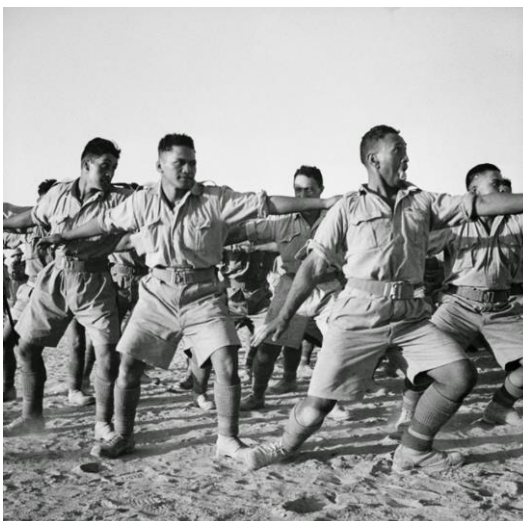
Obrázek 8 - Tanec HAKA dnes

„Exotický tanec Haka se zdaleka nepoužívá jen ve sportu, ale je i součástí pohřebních rituálů. Novozélandští vojáci tímto tancem uctili na pohřbu své tři padlé kamarády, kteří zemřeli v Afghánistánu.“ 65