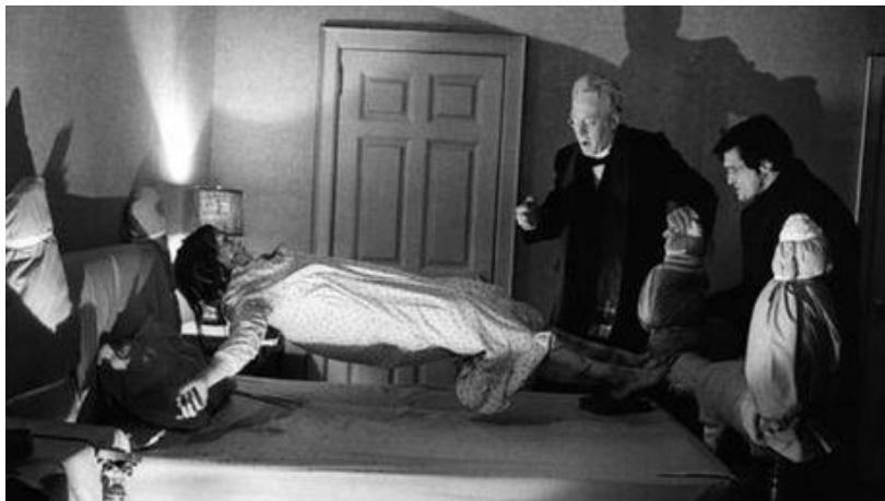
Obrázek 9 - Vymítání ďábla

V dnešní době se v Uzbekistánu nebo Tádžikistánu vyskutují léčitelé nazývaní – baxshi, kteří tancem léčí převážně duševní problémy, někdy spojovány s „posednutím ďábla“. 74 Tyto způsoby léčení souvisí i s taneční terapií.