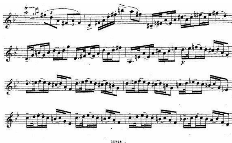
Obrázek 5 notová ukázka

vyspělost interpreta. Najdeme v ní kombinaci akordických rozkladů pod legátem i staccatem, kde můžeme pracovat s dynamikou. Od třetího taktu v ukázce 5 hrajeme mezzoforte až do pátého taktu třetí doby, kde nastupuje piano a probíhá až do sedmého taktu druhé doby, hned na třetí dobu hrajeme opět mezzoforte. V desátém taktu děláme postupně crescendo do písmene C. Ke zdůraznění technické náročnosti můžeme prodloužit první cis ve třetím taktu v přiložené notové ukázce a pak na notu a-cis-eis (noty, které jsou svázané legátem) užít nepatrný akcent, díky kterému se celkový dojem z pasáže stane zajímavějším.