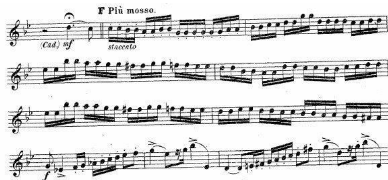
Obrázek 6 notová ukázka

Druhá věta koncertu Adagio festivo je krásná, až hymnická melodie ve které může interpret nechat naplno proudit své emoce. Je to opět melodie, ve které jsou cítit kořeny zrodu (Rusko). Oskar Böhme, ač původem Němec, byl dle mého názoru ve své tvorbě velice ovlivněn místem svého působení Ruskem a velmi pravděpodobně i ostatními skladateli své doby. Bohužel jeho působení v tehdy už bolševickém Rusku nemělo vzhledem k tehdejšímu politickému vývoji v Rusku šťastný konec, jak píše v kapitole 5.1.