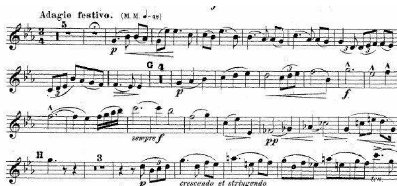
Obrázek 7 notová ukázka

Tato věta mi chvílemi připadá jako zpověď autora a jako ohlédnutí za svým životem. Z existujících historických nahrávek tohoto koncertu se mi jeví jako nepřirozenější nahrávka pořízená Timofejem Dokshitzerem. Dle mého názoru tento famózní ruský trumpetista asi nejlépe dokázal ve své interpretaci pochopit autorovo zadání.