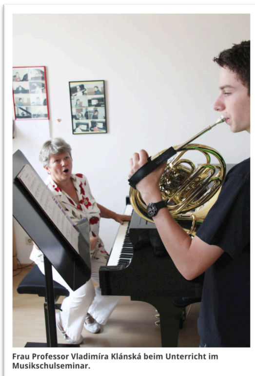
fotografie 5: pořízeno pořadatelem hudebních kurzů v Telfsu 35