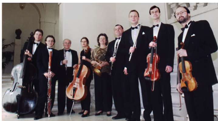
fotografie 3: bývalí a současní členové Českého noneta 12

"Byli jsme několikrát v Americe, několikrát v Anglii, v Edinburghu. Jezdili jsme po Španělsku, Německu, Francii, Švýcarsku a Japonsku. Zájezdová historie byla opravdu bohatá."