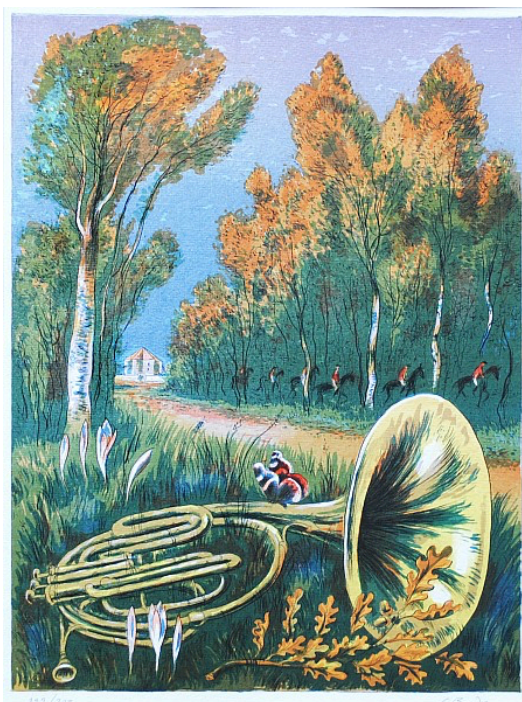
fotografie 6: litografie Lesní roh Cyrila Boudy 36