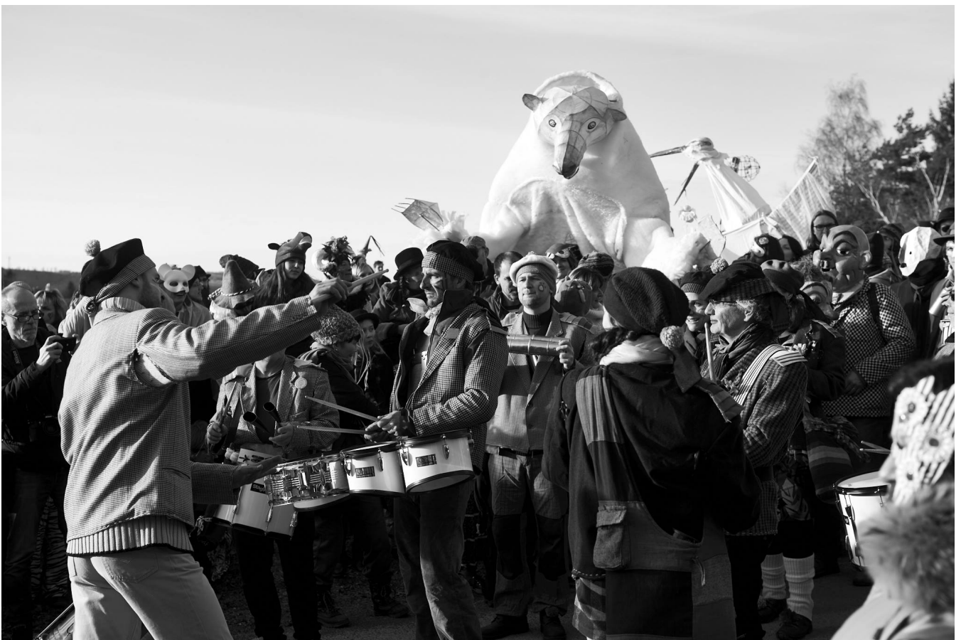
Bubeníci Blabuburo - kapela, která vznikla z bubenického kroužku při sdružení Roztoč, v pozadí Velká Medvědice, Roztoky 2017; foto Petr Bonek