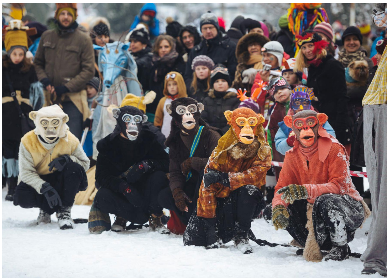
Opice, defilé masek na náměstí 2016, foto Jan Hromádko