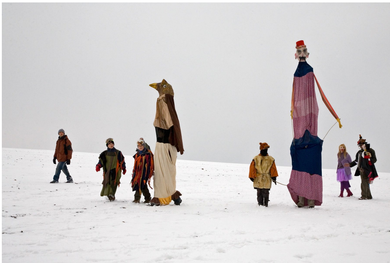
Sova a Turek na roztockém poli 2009