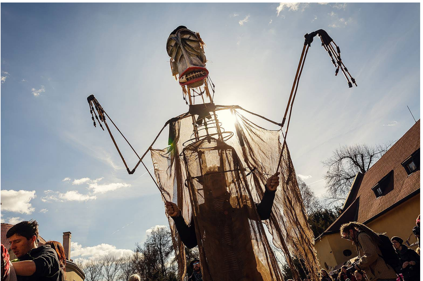
Půst 2017