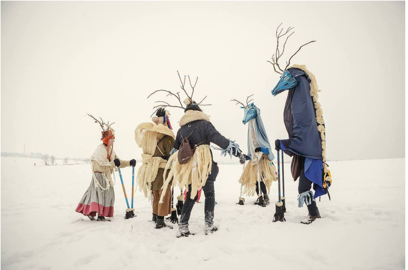
Modří Jeleni a šamanská svita Roztoky 2016