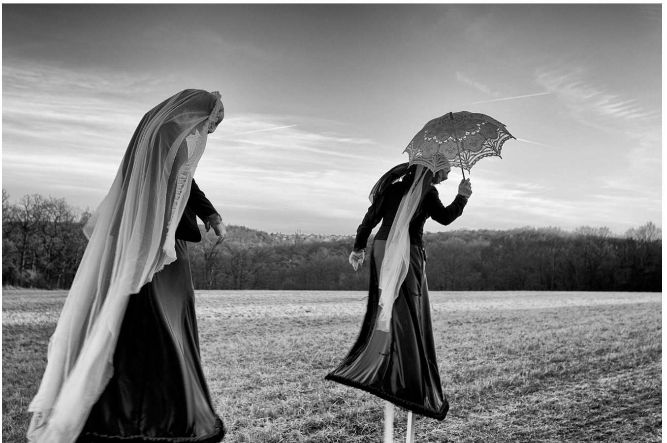
Dvě ze Sedmi Smrtí na poli 2017