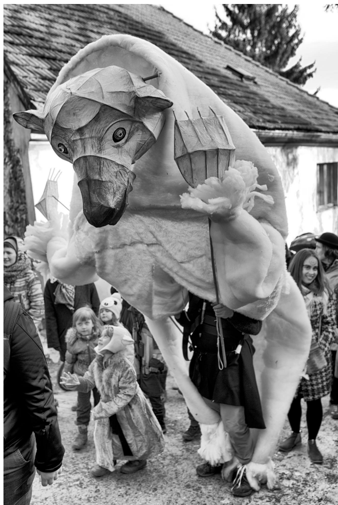
Bakus Terezy Slékové a Velká medvědice, kterou jsme si přivezli ze stáže v Hebden Bridge Roztoky 2017