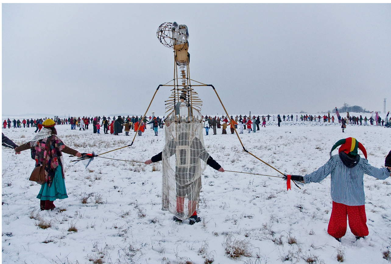
Smrt společně s ostatními v kruhovém tanci na Holém vrchu 2009