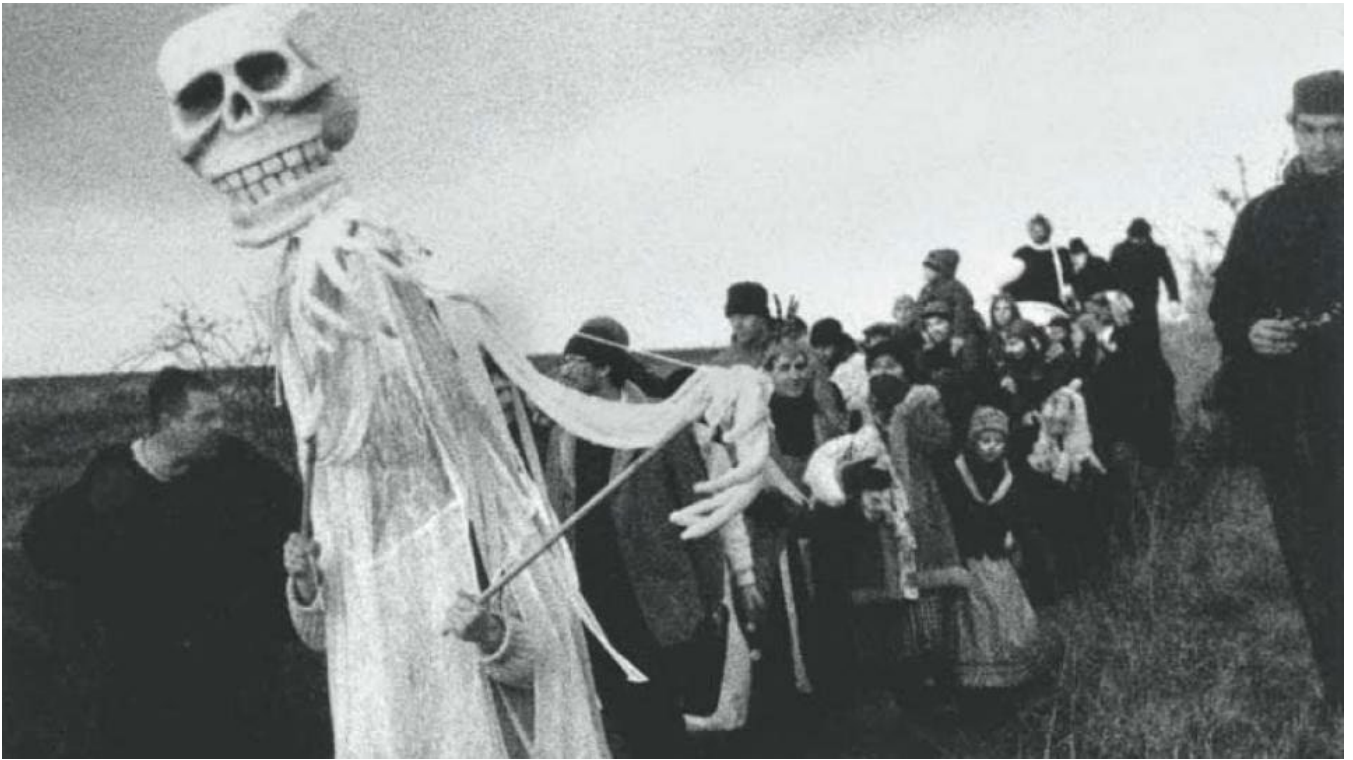
Únětická Smrt, na kterou M. Luskačová volala „Smrtko, počkej na mě!“ A pak spadla do úvozu a zranila se. foto z knihy „O smrti, koních a jiných lidech“ (Kniha zahrnuje fotografie z Roztoc-kého Masopustu od roku 1999 - 2010)