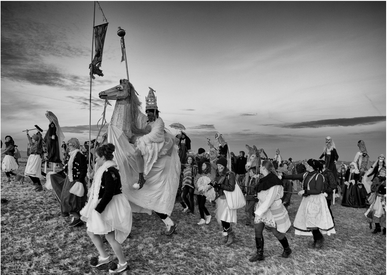
Královna David Ramdan zahajuje bitvu, Holý vrch 2017