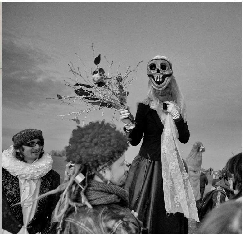
Návrh k Sedmi Smrtím, já jako Smrt, Holý vrch 2017