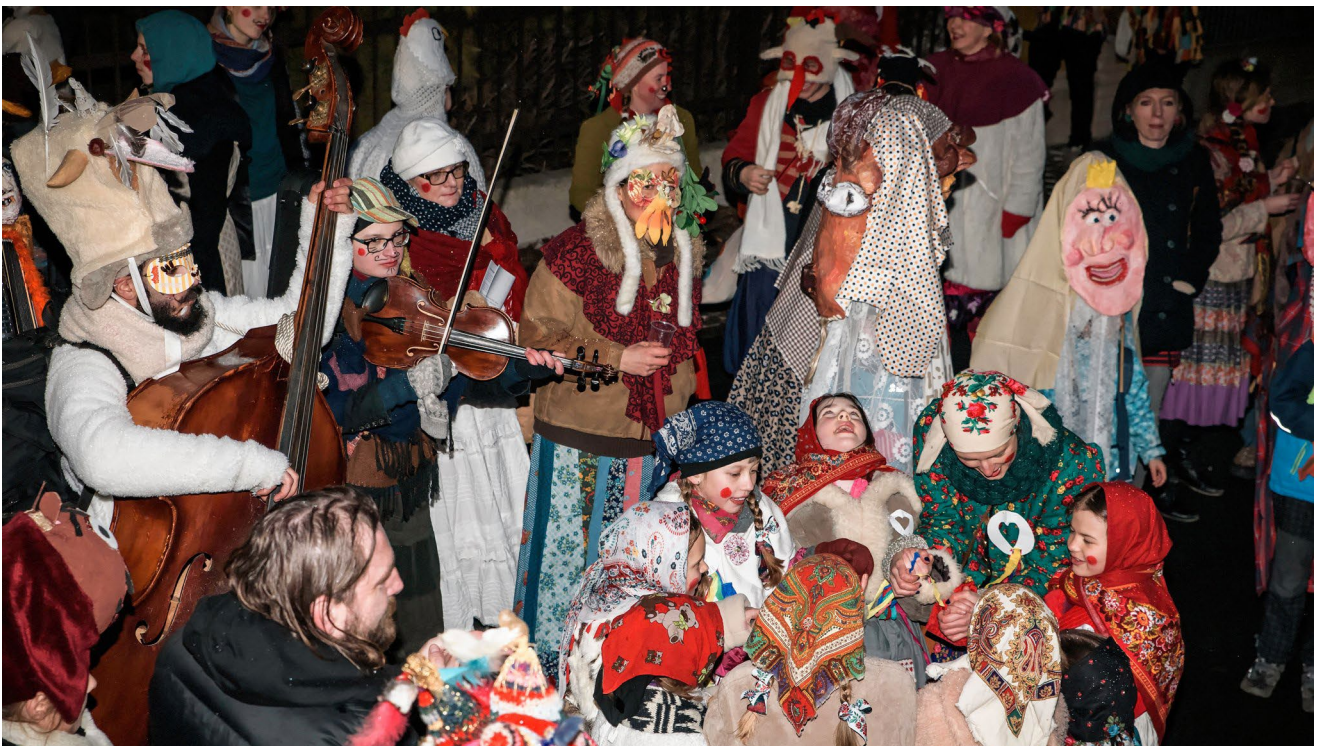
Muzička, rej maškar, děti z kroužku „Roztoč kolečko“ zpívají a tančí po domácnostech