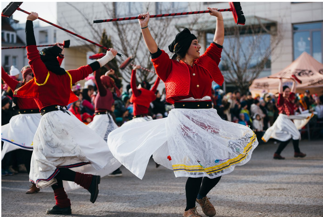
Ometačky, defilé masek na náměstí 2017