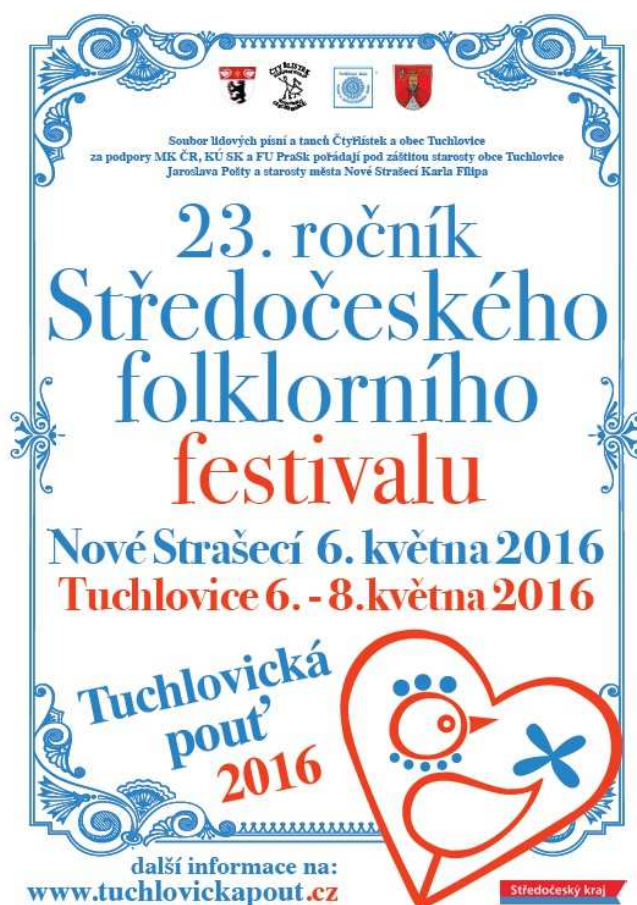
Obrázek 24 Plakát festivalu Tuchlovická pouť 2016

„Možnost obdivovat krásu lidových krojů a tanců a poslechnout si melodiku lidové muziky není v Praze a v jejím okolí zrovna časté. Folklorní příznivci ve Středních Čechách mají díky tomuto festivalu od roku 1994 pěknou tradici. Již pravidelně se během několika prvních květnových dnů v obci Tuchlovice u Kladna koná třídní folklorní festival, kterého se účastní až dvacet souborů dětí a dospělých z Čech, Moravy, Slovenska i z dalšího zahraničí. Od pátku do neděle se tanečníci a muzikanti představí divákům v řadě vystoupení na návsi, v sále hotelu Česká hospoda a především v rekonstruovaném areálu letního kina, kde se konají hlavní pořady festivalu.“ 92