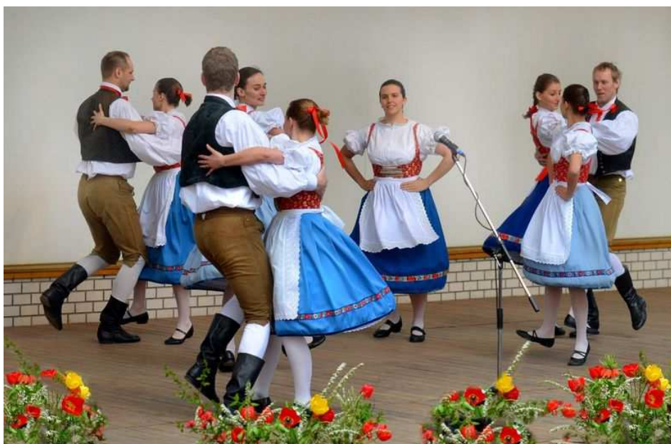
Obrázek 8 Soubor Čtyřlístek na festivalu Tuchlovická pouť , 2013. Pásmo Pivo , ženy, zpěv.

Rok 2012 byl opět ve znamení řady menších i větších vystoupení tuzemských, jako například: Národní krojovaný ples , 53 vystoupení v Lánech u příležitosti narození T. G. Masaryka, Tuchlovická pouť , Otevírání pramenů v Luhačovicích , 54 1. Západoslovanský folklorní festival v Kladně , 55 Dočesná v Kolečovicích , Třebovický koláč v Ostravě 56 nebo MFF v Písku . 57 Vánoce byly ve znamení nového pásma Desatero v choreografii Magdalény Pelcové a Zuzany Eržiakové a hudební úpravě Terezy Mlynaříkové.