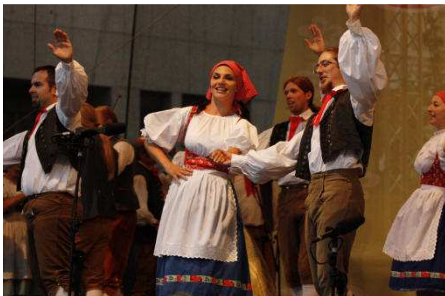
Obrázek 12 Soubor Čtyřlístek na festivalu Tuchlovická pouť .

Bonuš dále uvádí, že v oblasti pražského kraje se můžeme setkat se všemi základními typy českých tanců. Jsou to tance točivé , které se vyskytují zejména na Berounsku, kde jich několik zapsal K. J. Erben. Existují ale rovněž ojedinělé zápisy i z Rakovníka v rámci sbírky Adolfa Cmírala. Největší zastoupení mají tance figurální , které Bonuš rozděluje na tance řemeslnické, mateníky , společenské tance z doby národního obrození a figurální z období před obrozením, kam patří různé druhy dupáků , hulánů , husar , kozák , cvrček , pelikán , koniček , starobylý tanec , brandeburák , ježek , pětičtvrtní nebo manžestr . Dále se sem řadí tance jako skočná , vrták , obkročák , hulán , sousedská , furiant a polka . Mezi tance řemeslnické dává například nejrůznější druhy řezanek , šaryvary , oves , kominík , tkadlec , řezník nebo švec . Prvenství v oblasti mateníků připisuje Bonuš oblasti Polabí a uvádí i jejich odlišné pojmenování typu: vrtáky , kozly , směšky , latováky , klatováky . Ze společenských tanců národního obrození Bonuš zmiňuje především polku , krakováčky , rejdivák , rejdivačku , šotyš , minet , kolo , mazurku , valčík , polonézu nebo kadrily .