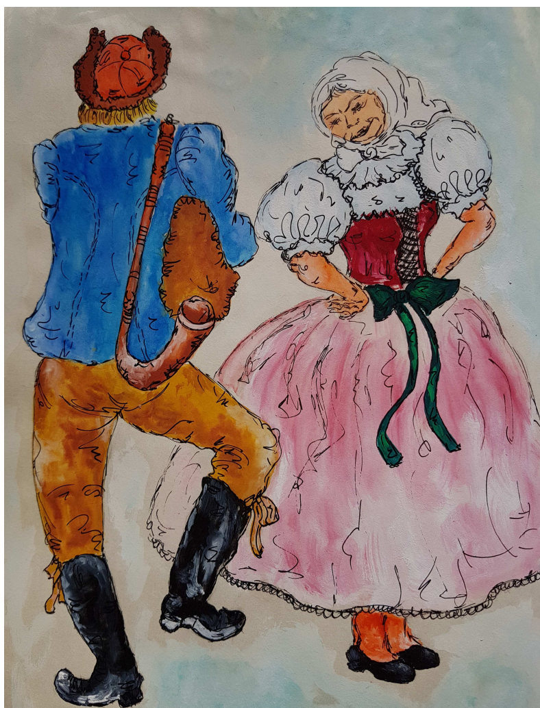
Obrázek 21 Kresba z kroniky Čtyřlístku

Kdo to praví, ten je blázen, že jsou ženský tak drahý. Na rynku jich prodávají čtyry za dva krejcary. Jeden mužskej za tisíce – ještě není k dostání.