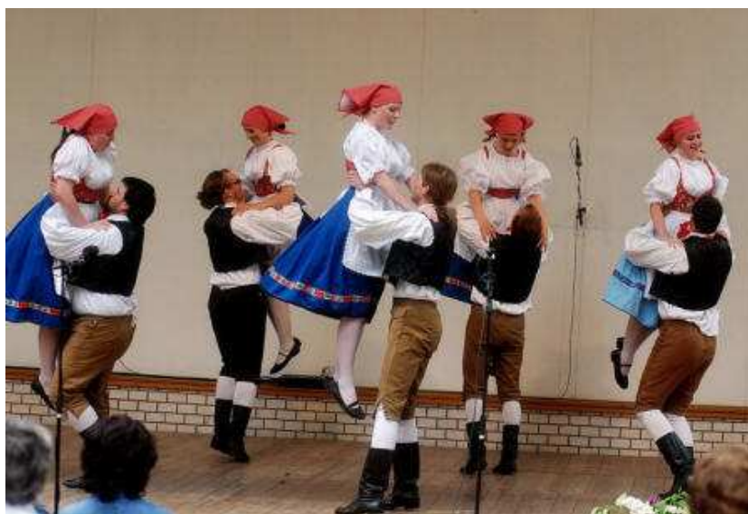
Obrázek 9 Soubor Čtyřlístek na festivalu Tuchlovická pouť, 2009. (Soukromý archiv Čtyřlístku)

Závěr roku 2016 byl ve znamení tradičních 'Vánoc se Čtyřlístkem.' „Ty se nesly v duchu oslav 40. výročí vzniku souboru a 60. výročí nepřetržité činnosti cimbálové muziky. Všechny akce – hlavní pořad 'Nad kronikami' s premiérou pásma 'Betlém,' výstava, setkání u štědrovečerního stromu i výroční beseda u cimbálu – měly veliký divácký ohlas.“ 63