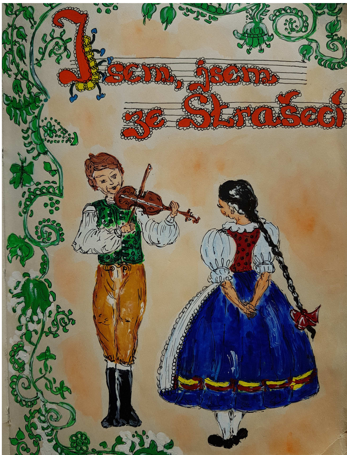
Obrázek 27 Kresba z kroniky Čtyřlístku (Soukromý archiv Čtyřlístku)