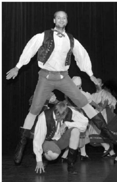
Čtyřlístek při Tuchlovické pouti 2012 v Novém Strašecí.