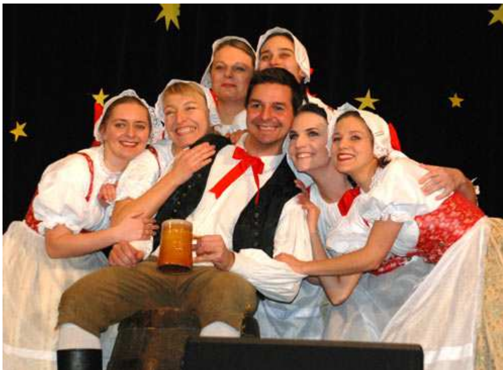
Do programu loňských oslav 40. výročí zařadil Čtyřlístek ukázky ze stěžejních pásem své historie.