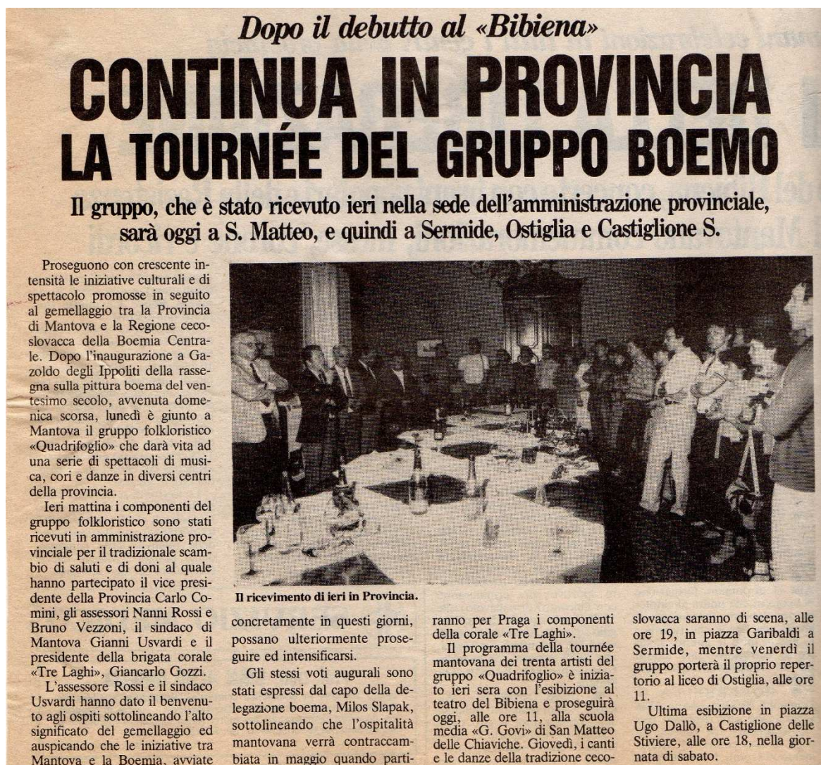
Obrázek 4 Článek z Gazzetta di Mantova , duben 1985. (Kronika Čtyřlístku)

Stránská. 27 Brzy nato byla souboru nabídnuta možnost reprezentace Středočeského kraje při navázání družebních styků s provincií Mantova v Itálii. Vznikl tak program, který sestával ze čtyř půlhodinových bloků.