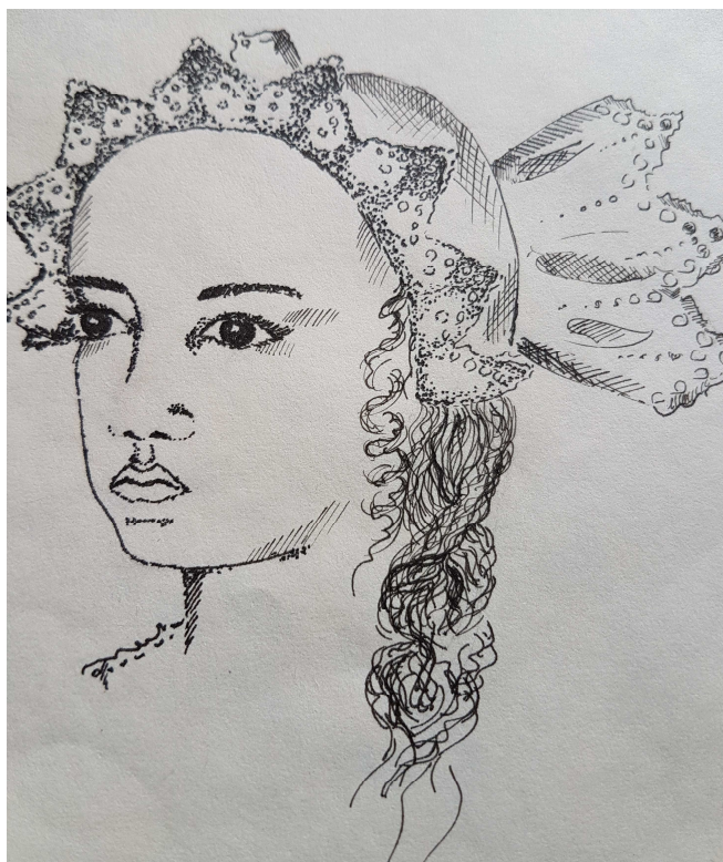
Obrázek 22 Kresba z kroniky Čtyřlístku (Soukromý archiv Čtyřlístku)