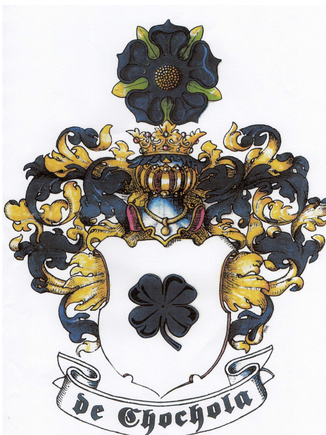
Obrázek 28 Erb Řádu duševních rytířů Modré růže