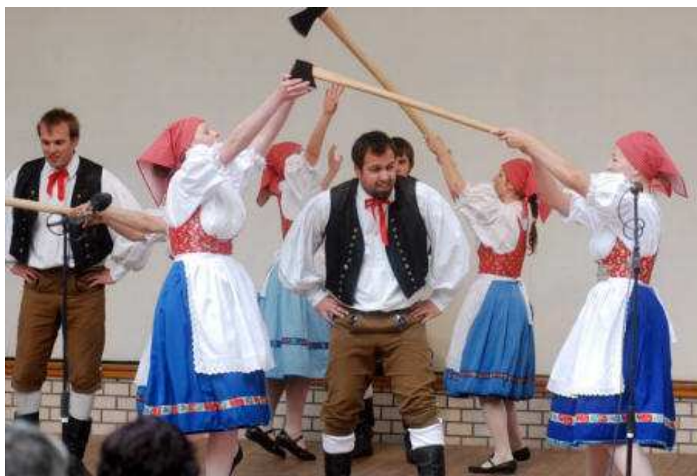
Obrázek 26 Vystoupení souboru Čtyřlístek na Tuchlovické pouti , 2009. Pásmo Lešťovinky . (Soukromý archiv Čtyřlístku)