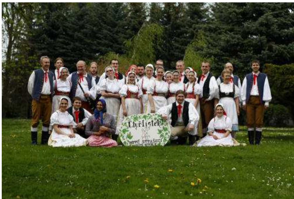
Obrázek 11 Soubor Čtyřlístek na festivalu Třebovický koláč v Ostravě, 2012.