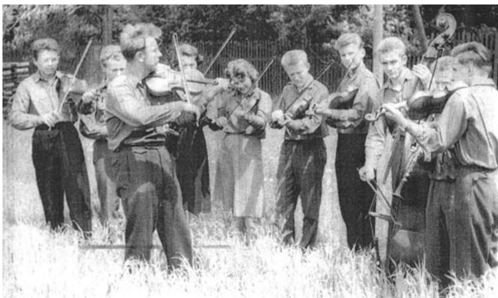
Nejstarší snímek cimbálovky z roku 1959.