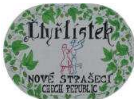
Obrázek 10 Logo souboru Čtyřlístek